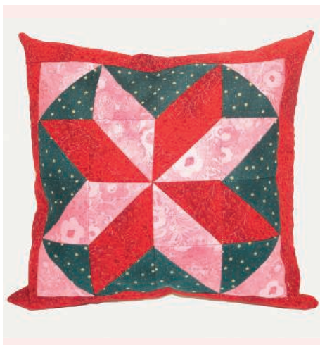
Подушка «звезда» 156