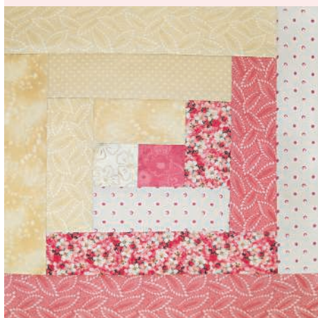
Колодец, или изба 102