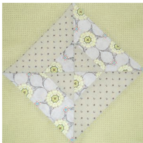
Быстрый квадрат 76