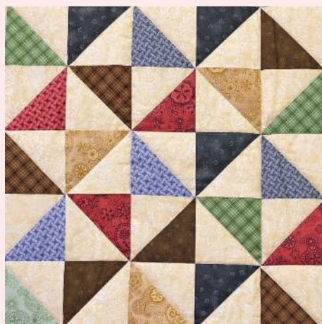
Веселые треугольники 112