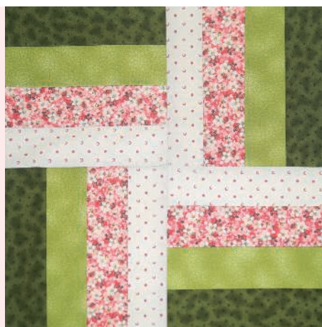
Полоска к полоске 88