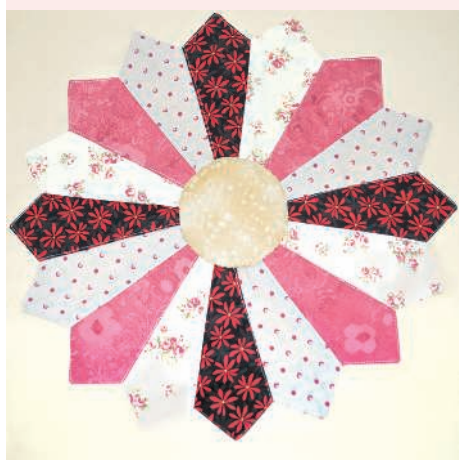
Дрезденская тарелка 134