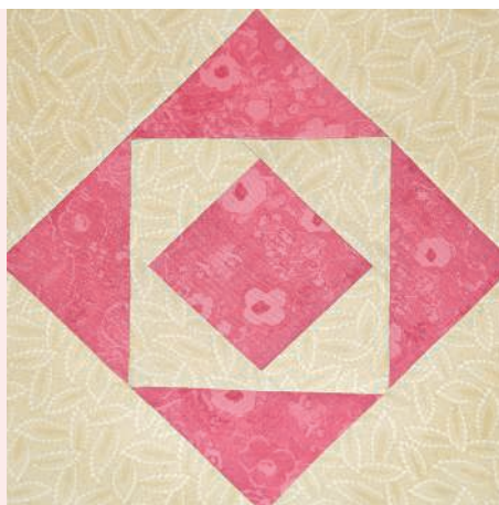
Русский квадрат 52