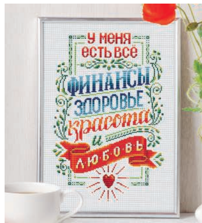
С. 25, 80