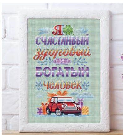
С. 29, 86