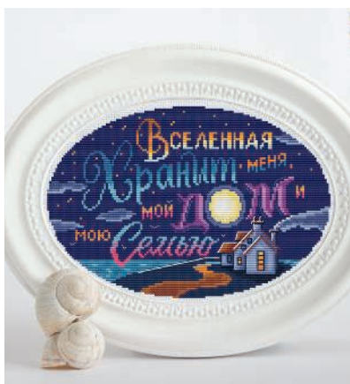
С. 27, 116