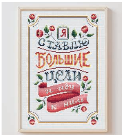
С. 21, 50