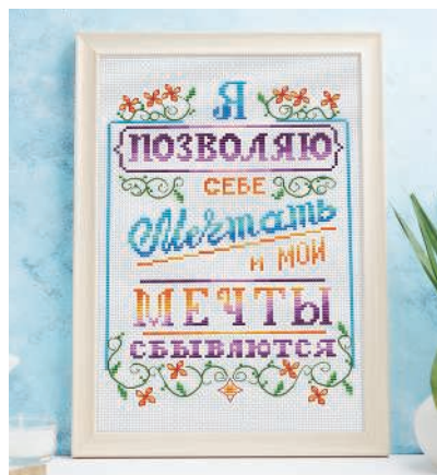
С. 15, 56