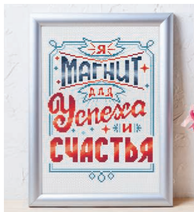
С. 17, 62