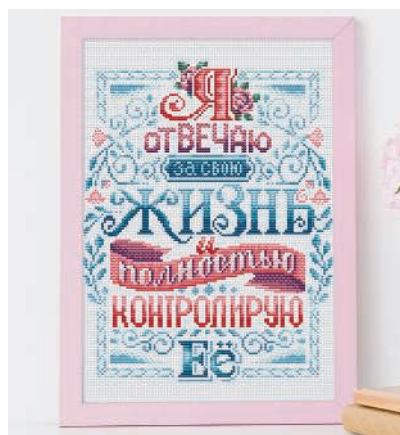
С. 9, 38