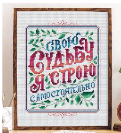
С. 11, 44