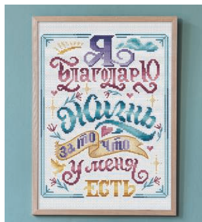
С. 31, 92