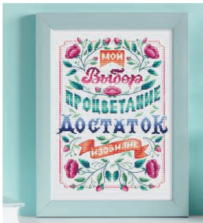
С. 33, 98