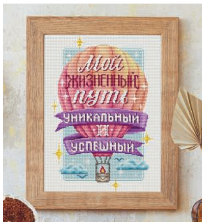
С. 23, 74