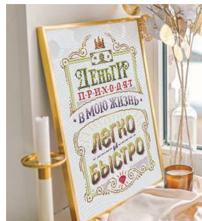
С. 19, 68