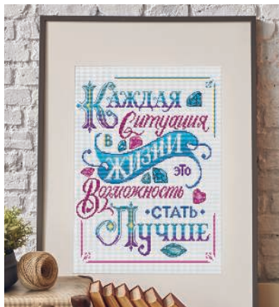
С. 35, 104