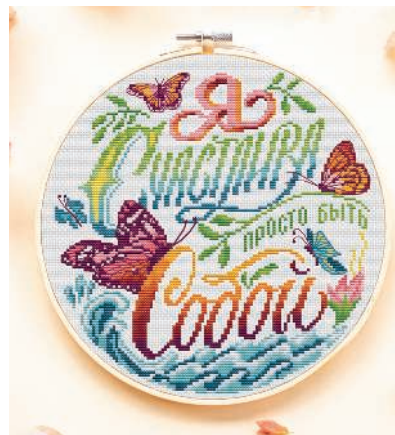
С. 37, 122