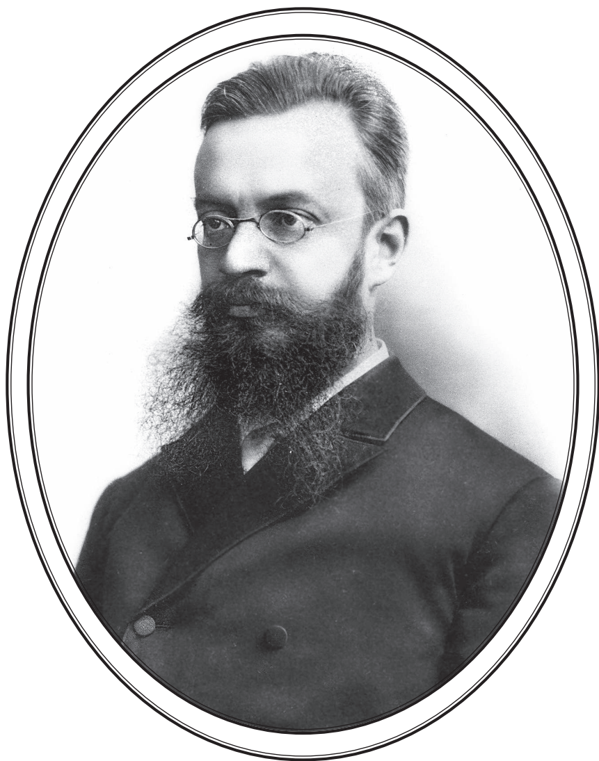
Григорий Ефимович Грумм-Гржимайло 1860—1936