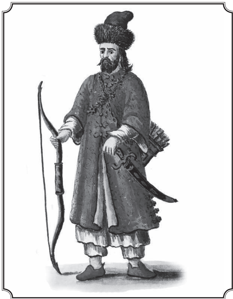
Марко Поло в татарском костюме.