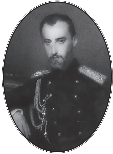
Великий князь Николай Михайлович (1859—1919)

«Из газет вы, может быть, уже знаете, — писал Грум-Гржимайло своему крестному отцу в феврале 1887 г., — что я, пространствовав три года по пустыням и нагорьям Центральной Азии, ныне вернулся в Петербург и здесь совместно с некоторыми специалистами... принялся за разработку собранных мною, смею думать, обширных научных материалов. Хотя кое-что уже и опубликовано, но впереди предстоит сделать еще чрезвычайно много. Существуют и пробелы. Совсе не исследованы юго-восточные склоны Памира, не имеется никаких зоогеографических данных о Джаттышаре*. Требуется составить новую экспедицию. Средства, однако, на ее выполнение нет у меня никаких.