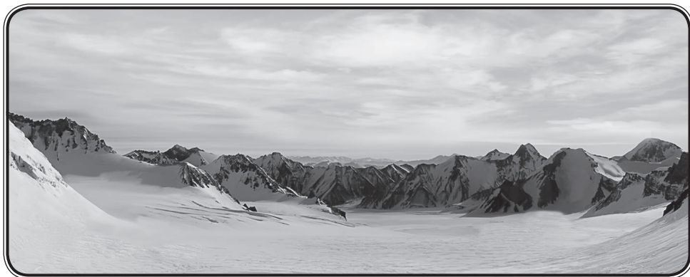
Панорама верховий ледника Грумм-Гржимайло (Центральный Памир, Таджикистан). Современная фотография

Явление вполне распространенное: благородство крови — единственный «дивиденд» древности рода. Впрочем, еще в начале XIX столетия Григорий Грумм-Гржимайло, дед Григория Ефимовича, владел обширными имениями, однако быстро их утратил. Так что Ефиму Григорьевичу Грумм-Гржимайло, появившемуся на свет в 1824 г., пришлось всего добиваться самому. Он был известен как один из ведущих российских специалистов свеклосахарной и табачной промышленности, способствовал их развитию в России, являлся автором ряда публикаций по этой теме.