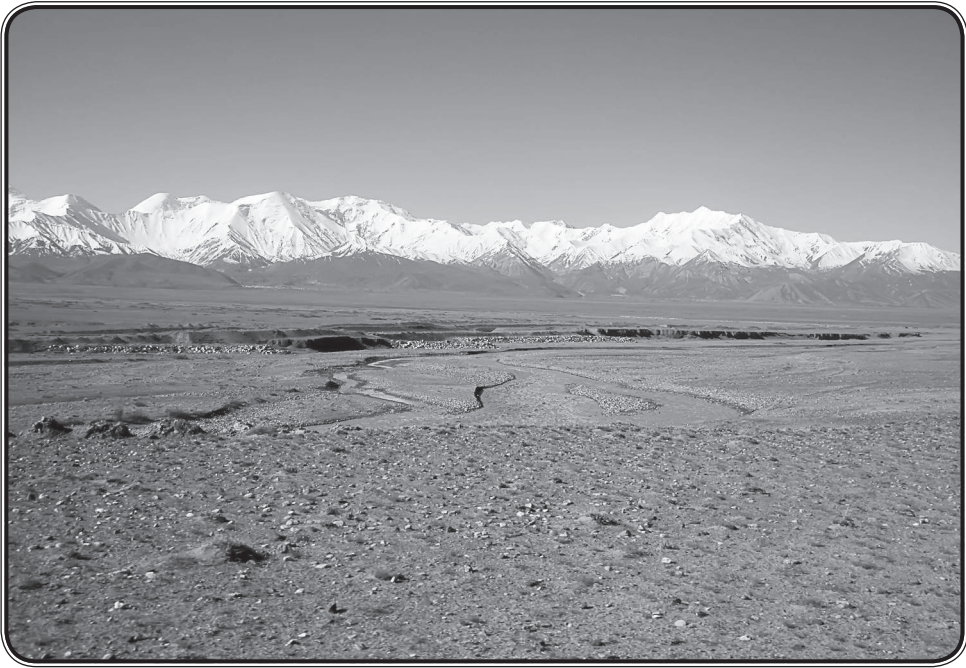
Алайская долина и Заалайский хребет. Современная фотография

В середине сентября 1885 г. Грум-Гржимайло вернулся в Санкт-Петербург. А на декабрь того же года был назначен его выход в «географический свет» — доклад на заседании Русского географического общества.