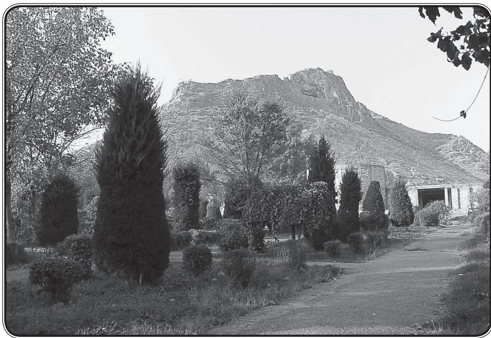
Вид на горы из города Ош. Современная фотография

В начале 1886 гг. Г. Е. Грумм-Гржимайло начал готовиться к очередной экспедиции. На этот раз он должен был исследовать западные отроги Тянь-Шаня. Одной из главных задач путешествия было исследование зоогеографической взаимосвязи