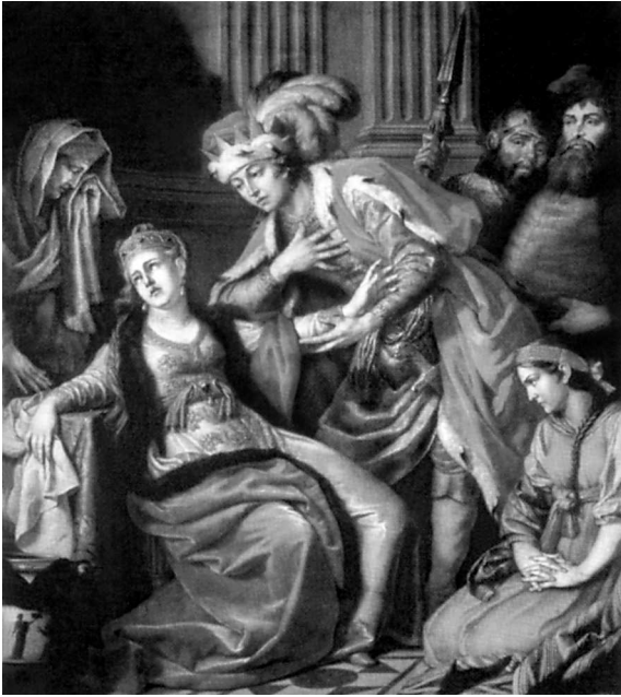
Владимир и Рогнеда. Худ. А.П. Лосенко

черт, в достоверности которых можно скорее сомневаться, чем принимать их на веру. Откидывая в сторону все, что может подвергаться сомнению, мы ограничимся короткими сведениями, которые при всей своей скудости все-таки достаточно показывают чрезвычайную важность значения Владимира в русской истории.