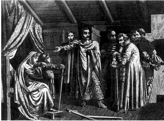
Суд над Рогнедою. Худ. В.П. Верещагин

ям — сыном греческой царевны. Наши историки, желая сочетать эти известия, полагали, что царевна, отданная в замужество за Владимира Святого, была не родная, а двоюродная сестра греческих императоров, дочь болгарского царя Петра. Была ли она двоюродная сестра Василия и Константина или же родная — до сих пор не решено, но во всяком случае очень вероятно, что Борис и Глеб были дети этой царевны, и Владимир как христианин оказывал им предпочтение перед другими сыновьями, считая их более законными по рождению, так как с их матерью он был соединен христианским браком и они, кроме того, предпочтительно перед другими имели право на знатность происхождения по матери от царской крови.