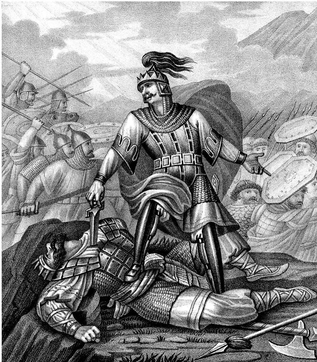
Единоборство Мстислава Удалого с Редеею.

ченегам; на помощь киевлян, как видно, он также не рассчитывал. Ярослав стал на берегу Альты, на том месте, где был убит брат его Борис. Там, в одну из пятниц 1019 года, на восходе солнца, произошла кровавая сеча. Святополк был разбит и бежал. По известиям нашей летописи, на него нашел какой-то безумный страх: он так ослабел, что