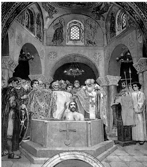
Крещение князя Владимира в Херсонесе (Корсуни). Худ. В.М. Васнецов

пре отчасти потому, что в самом Киеве уже значительно распространено было христианство и христиане не составляли там незначительного меньшинства, а более всего оттого, что у русских язычников не было жреческого сословия, которое бы разъяснило народу преступность такого переворота с языческой точки зрения и возбуждало бы толпу к сопротивлению.