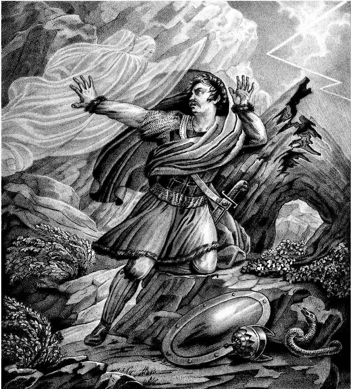
Святополк, терзаемый угрызениями совести.

мех, так как меха были мерилем ценности вещей; отсюда слово «куна» стало означать монетную единицу. Гривна — собственно весовая единица, но в перенесении понятия сделалась крупной монетой, единицей вроде английского фунта стерлингов. Первоначально гривна серебра — фунт, потом, уменьшаясь, дошла около полфунта; гривна