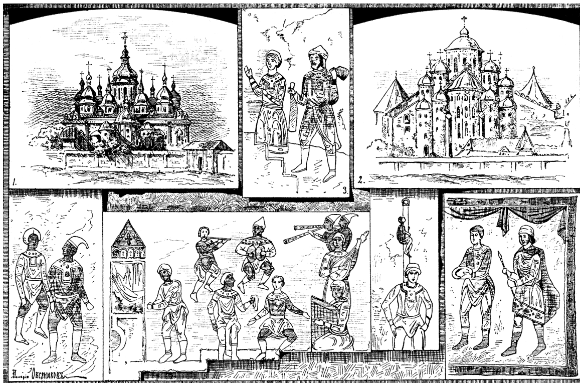
1. Киево-Софийский собор. 2. Тот же собор по рисунку XVII века. 3, 4, 5. Древние фрески на стенах собора.

был сослан в Ростов, а потом убит в Муроме. В 1038 году Ярослав посадил в Новгороде сына своего Владимира, а после его смерти, в 1052 году, посажен был сын Ярослава Изяслав, и с тех пор в Новгороде постоянно уже были особые князя; преимущественно же в первое время выбирались старшие сыновья киевского князя.