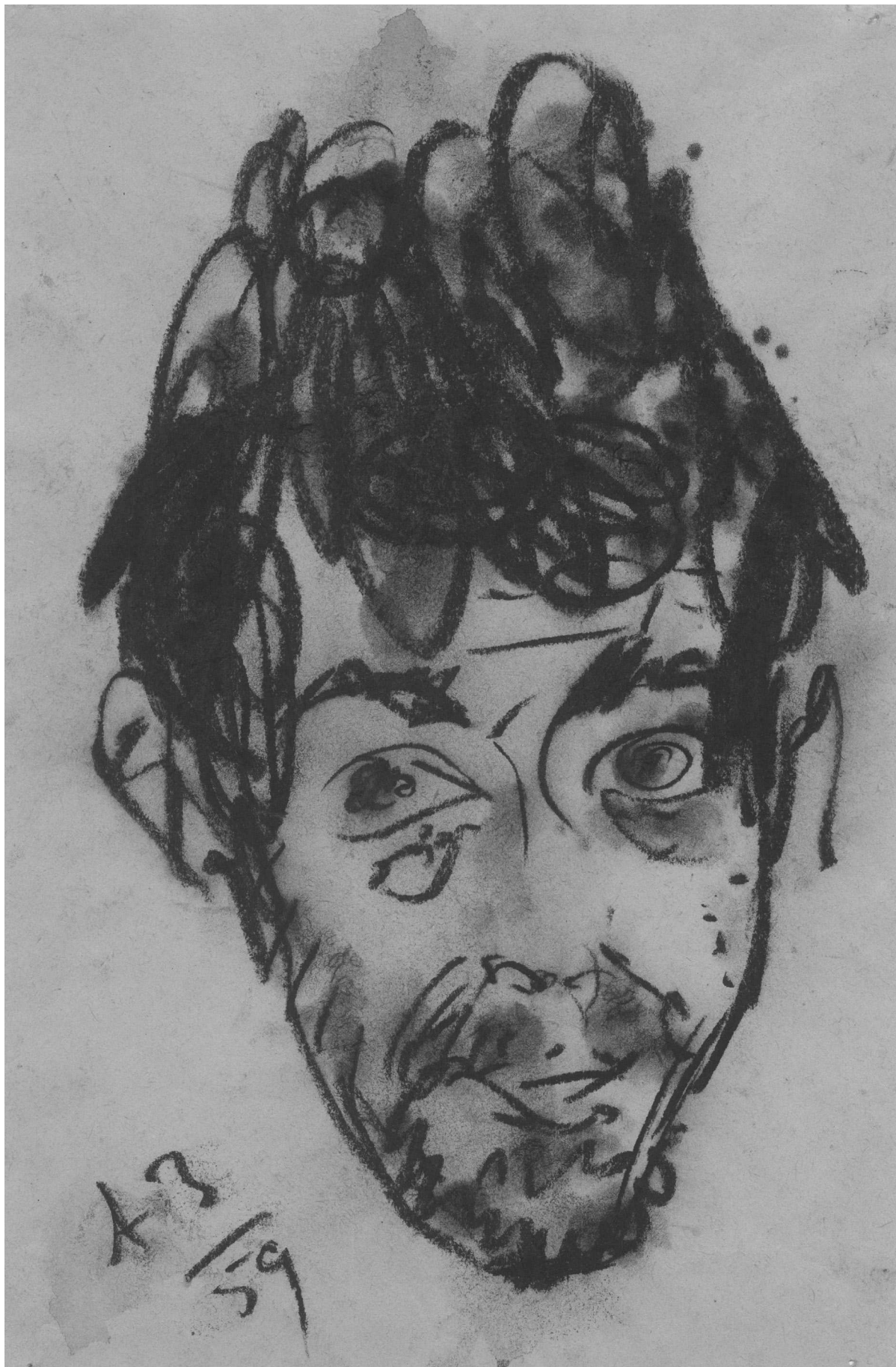
Анатолий Зверев. Автопортрет. 1959. Бумага, уголь. 39×25,7 см