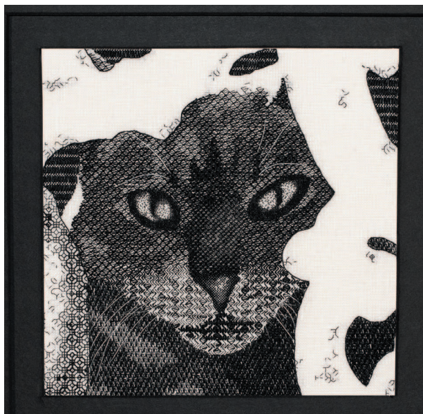
«Кот, смотрящий сквозь решетку», учебная работа Джен Гудвин, 2001 г. На изнанке негативного пространства изображения решетки заметны тянущиеся нити. Их можно было легко удалить перед оформлением

ных образчиках показаны крупные четкие узоры в сочетании со сплошными геометрическими фрагментами и художественной штопкой, комбинированной с элементами золотого шитья. Можно сказать, что эти образцы демонстрируют промежуточный этап дальнейшей эволюции блэкворка. В них явно чувствуется влияние исторической вышивки, но выглядят они уже гораздо более современно. В 1960-х гг. этот новый стиль продолжил свое развитие, когда стали использовать нити различной толщины и по-разному экспериментировать с ними. Этим новым витком своего развития техника блэкворк обязана нескольким мастерицам из Гильдии вышивальщиц, прежде всего Мойре МакНил и Элизабет Геддес, издавшим в 1965 г. книгу «Блэкворк». Такой принцип был позднее