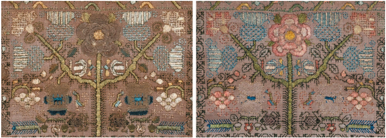
Образец вышивки в виде ленты из частной коллекции Лорейн МакКлин. Лицевая часть показана на фото слева, справа — изнаночная сторона, на которой видна черная вышивка, аккуратно выполненная швом Гольбейн, а также изначальная яркость оттенков образца