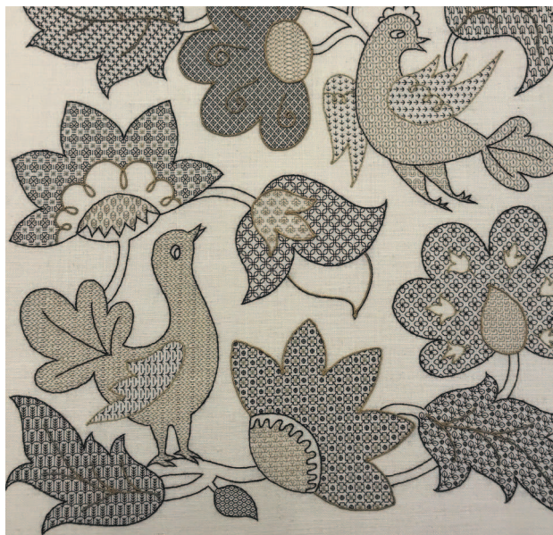
Коллекция Королевской школы вышивания. Работа Дороти Абнетт на вечерних курсах, 1956 г. Этот образец показывает различные способы заливки, которые были подчеркнуты золотом в елизаветинском стиле