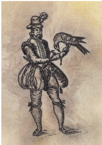
Пример вышивки работы Джен Гудвин, 2019 г. Эта современная копия выполнена комбинацией шва «вперед иголку», стебельчатого шва и французских узелков на вручную раскрашенном фоне

цвета, встречаются редко — чаще всего использовались красные и синие оттенки, — они относятся к тому же периоду, что и образцы блэкворка. Вышивка ассизи чаще всего использовалась для изображений религиозной тематики, а также из области мифологии эпохи Ренессанса — фантастических животных, часто в рамках украшенных завитками.