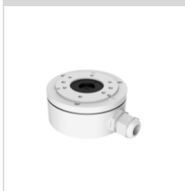
DS-1280ZJ-XS Монтажная коробка