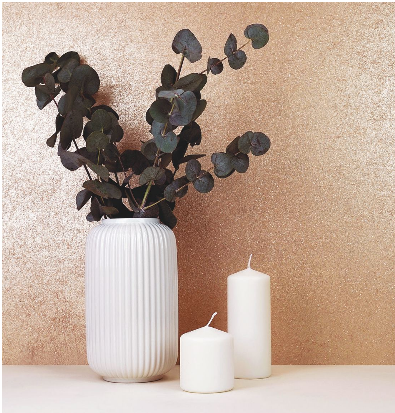
Beige gold (бежевое золото) B03

Коллекция BREEZE создана для изысканных интерьеров в различных направлениях: лофт, современная классика, эклектика и модерн. Цветовая палитра подойдет для ценителей классических оттенков золота, серебра и перламутра.