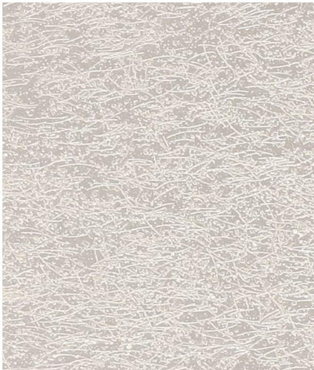
Pearl (жемчужный) B01