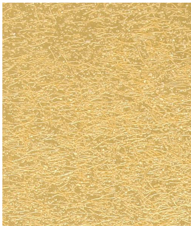
Gold (золото) B04