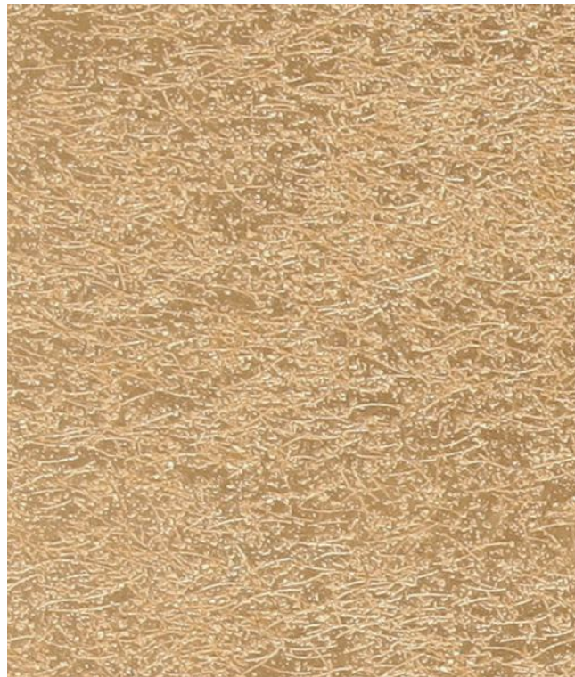
Beige gold (бежевое золото) B03