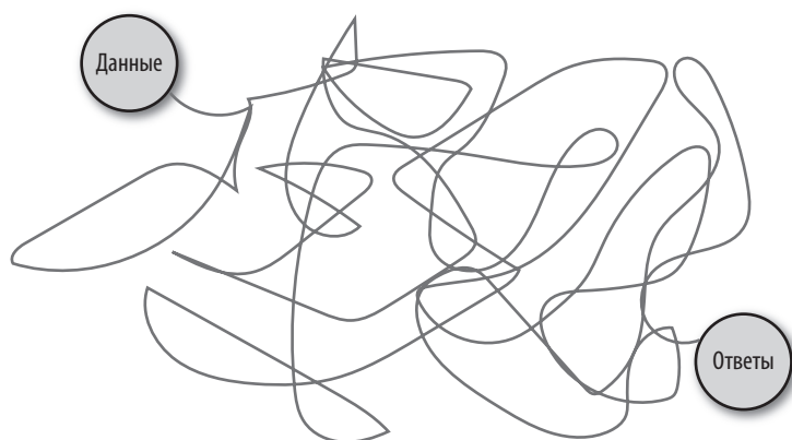
Рис. 1.1. Сад разветвляющихся дорог на пути от данных к ответам

что изначально кажется просто догадкой, в итоге может привести к наилучшему решению. Работа с потоками данных обычно многоэтапный и циклический процесс. Например, за стоимостью ценных бумаг наблюдают на бирже, затем эту информацию собирает воедино брокерское агентство вроде Thomson Reuters, заносит в базу данных, их покупает другая компания и преобразует в хранилище HIVE на кластере серверов Hadoop. Из хранилища их извлекают одним скриптом, разбивают на подгруппы, обрабатывают и очищают другим скриптом, помещают в файл и снова преобразуют в формат, с которым может работать ваша любимая библиотека R, Python или Scala. Прогнозы цен снова помещаются в CSV-файл и разбираются алгоритмом оценки. Модель при этом изменяется несколько раз, переписывается на C++ или Java вашими разработчиками, и через нее вновь пропускают все данные, прежде чем предсказания попадут в новую базу данных.