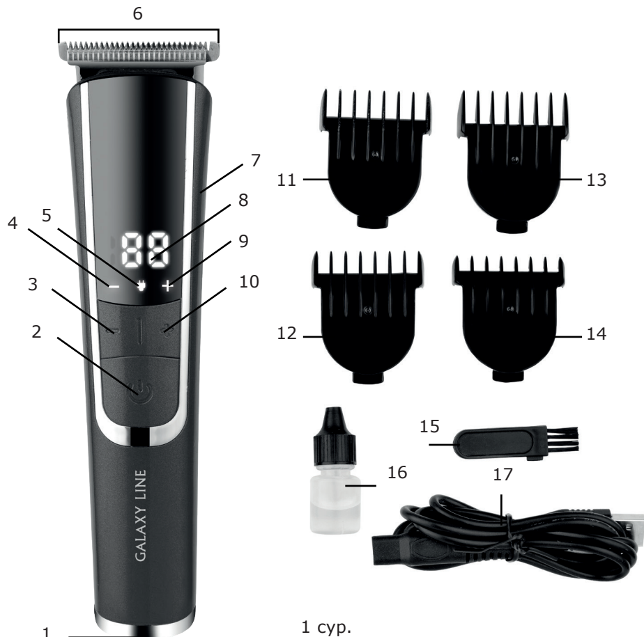
1 сур. Электр құралының элементтері (1 сур.):