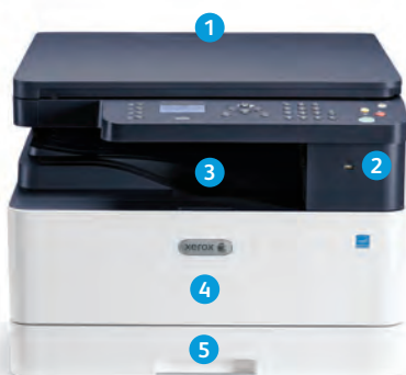
Многофункциональное устройство Xerox® B1022

9 МФУ Xerox® B1025 оснащено цветным сенсорным интерфейсом с диагональю 4,3 дюйма, дополнительно упрощающим работу.