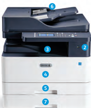
Многофункциональное устройство Xerox® B1025

Конфигурация DADF показана с опциональным дополнительным лотком.