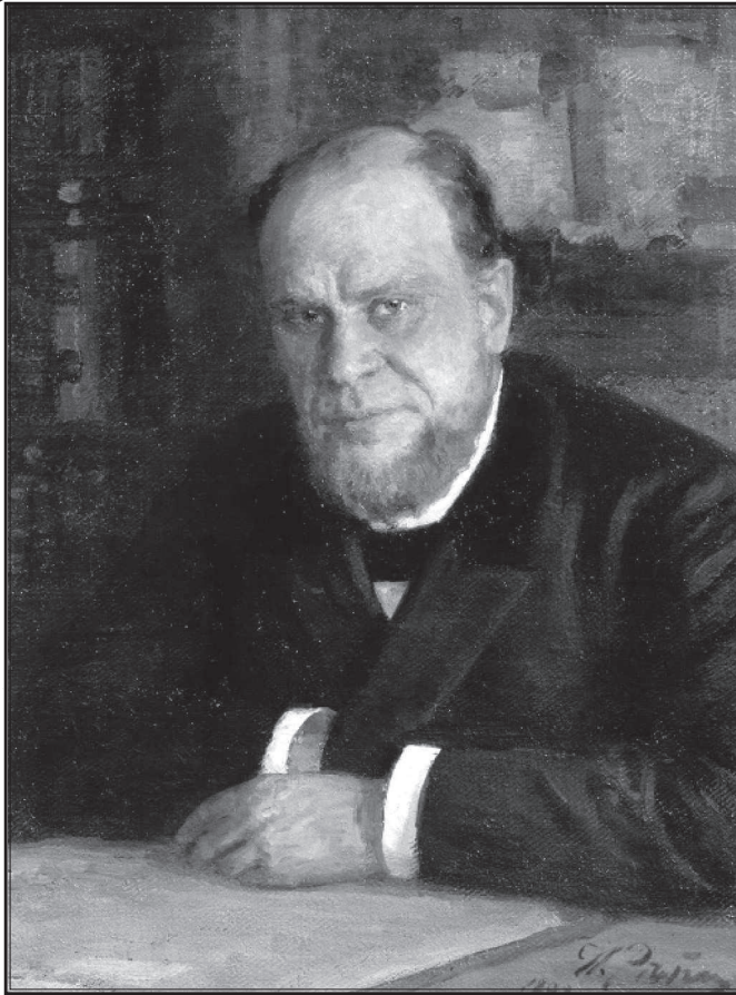
И. Е. Репин. Портрет А. Ф. Кони. 1898 г.

вызванными, как правило, устранением некоторых повторений фактического материала.