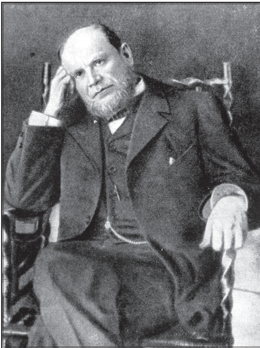
А. Ф. Кони (1844—1927).