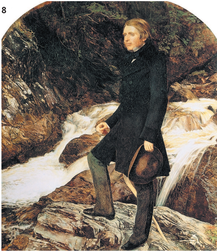
Джон Эверетт Милле. Портрет Джона Рёскина. 1853—1854 гг.

Изобразить среди трав и растений тайны созидания и сочетаний, которыми природа говорит нашему пониманию; передавать нежный изгиб и волнистую тень взрыхленной земли; находить во всем, что кажется самым мелким, проявление вечного божественного новосозидания красоты и величия; показывать это немыслящим и незрящим — таково назначение художника.