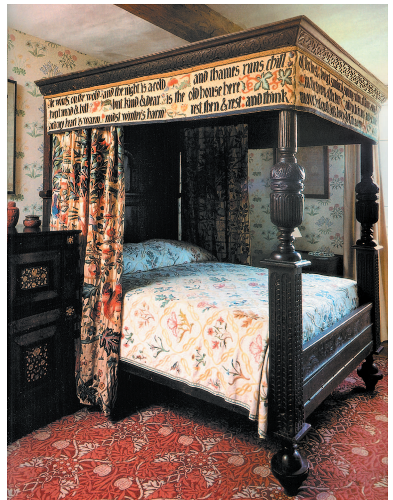
Спальня Уильяма Морриса в поместье Келмскотт. Ок. 1862 г.

Невозможность приобрести необходимые вещи для оформления своего дома побудила Морриса создать в 1861 году собственную компанию.