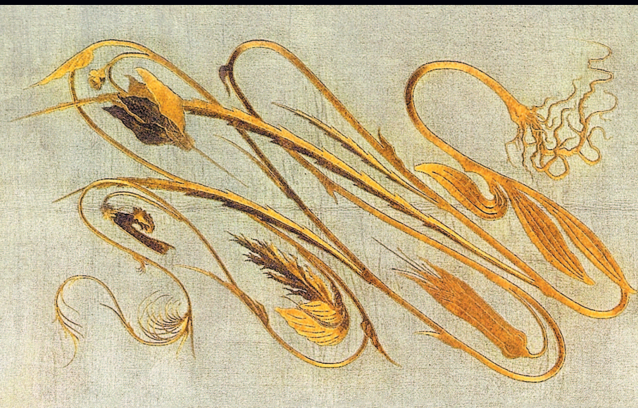
Герман Обрист. Портьерный узор «Удар бича». Вышивка золотым шелком. 1895 г.

Рисунок Обриста показывает растение целиком, включая бутон, цветок, листья и корень. Первоначально работа называлась «Альпийские фиалки», но, когда один из критиков сравнил движение стебля растения с «яростными изгибами обрушивающегося бича», родился термин «удар бича», который вскоре стал фирменным росчерком Арт Нуво.