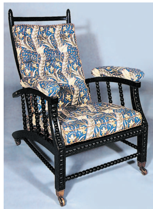
Филипп Уэбб. Кресло Морриса. Ок. 1865 г.

Уильям Моррис (дизайн, концепция), Эдвард Бёрн-Джонс, Данте Габриэль Россетти (декор). Пара стульев с высокой спинкой. 1856 г.