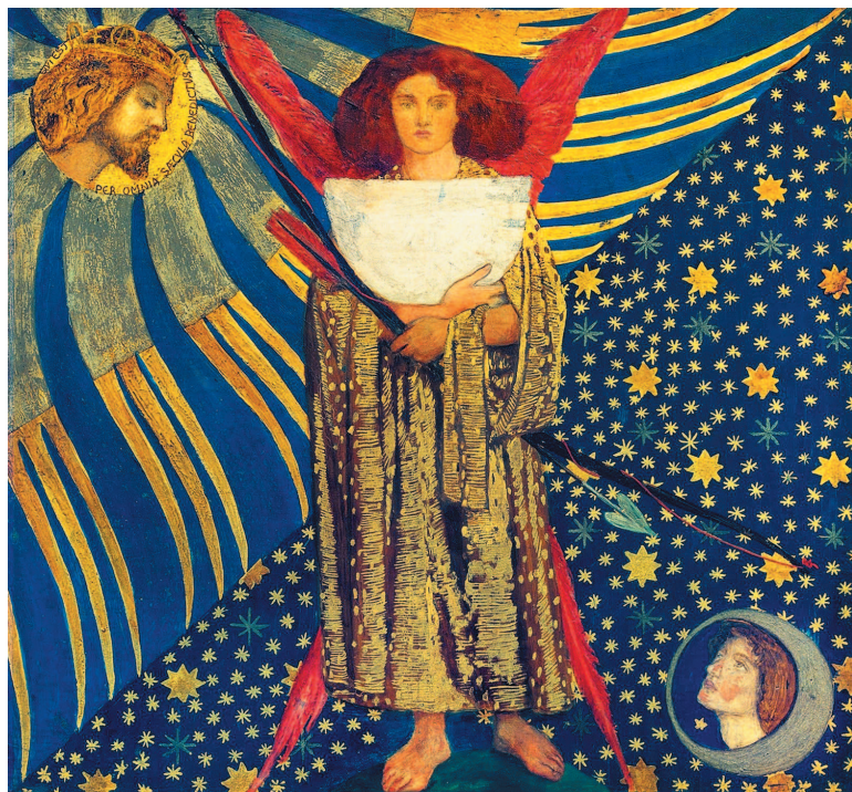
Данте Габриэль Россетти. Dantis Amor (Любовь Данте). 1859 г.

Декоративизм этой картины вдохновлял художников модерна. Пространство заменено плоским орнаментом. Лучеподобные линии струятся из нимба вокруг головы Христа, а все небо вокруг центральной фигуры поэта усеяно звездами. Возлюбленная Данте Беатриче смотрит на него, обрамленная закругленным месяцем.