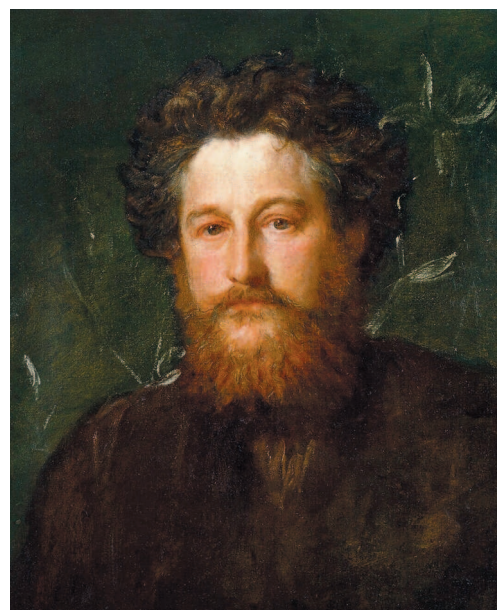
Джордж Фредерик Уотс.

Еще во время учебы в колледже Моррис познакомился и подружился с Эдвардом Бёрн-Джонсом (1833—1898). Молодых людей объединила любовь к Средневековью. Летом 1856 года Моррис знакомится с Данте Габриэлем Россетти (1828—1882), которого считал «главной фигурой прерафаэлитского движения». Россетти дал согласие на работу в созданном Моррисом журнале Oxford and Cambridge Magazine , продолжавшем дело журнала прерафаэлитов «Росток». Моррис публиковал в нем свои поэтические произведения и статьи по теории декоративных искусств. Сам журнал просуществовал недолго, но сотрудничество с Россетти продолжалось. Увлечение Морриса легендами о короле Артуре вдохновило его на создание одного из самых удачных литературных проектов прерафаэлитов — сборника «Защита Гвиневеры и другие стихи», вышедшего в 1858 году.