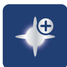
До 5000 Кельвинов 1), 2)

Кристалльно-белый свет с эффектом светодиодного освещения – для стильного облика автомобиля