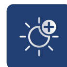
До 100% больше света 1), 3)

Эффектный белый свет и высокая контрастность освещения – для стильного облика автомобиля