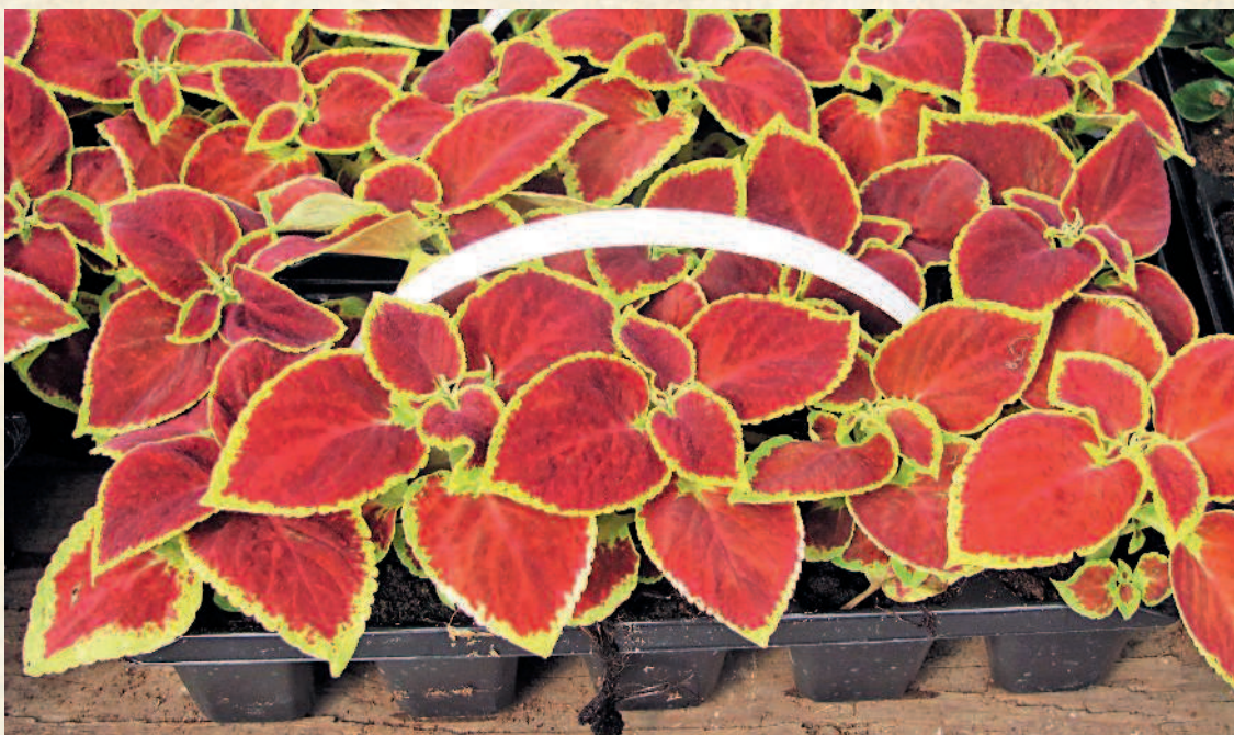
Рассада колеуса в кассетах

выбор растений знающему цветоводу, поскольку русские переводы названий растений не всегда бывают корректными. Поэтому в описаниях родов и видов даны не только само латинское название, но и синонимы.