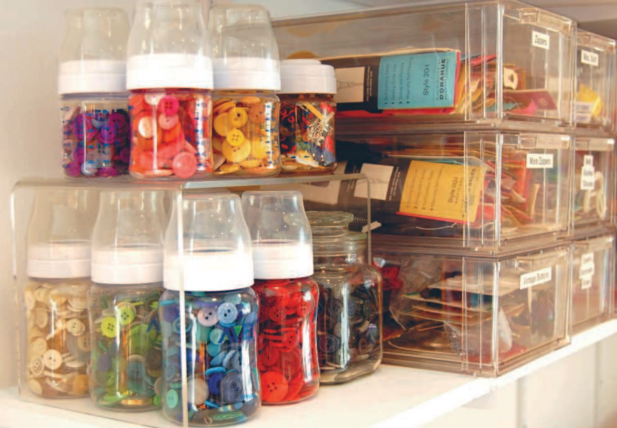
Детские бутылочки и старые банки отлично подходят для тесьмы и пуговиц.