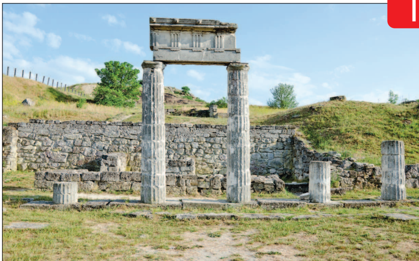
Руины древнего города Пантикапея