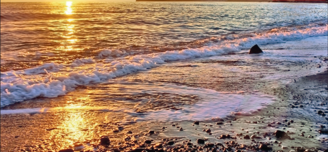
Вид на мыс Капчик в Новом Свете

Край мечтательных писателей и поэтов, вдохновенных художников, отважных мореплавателей, свободных воздухоплателей и преданных виноделов — одним словом, романтиков, которые сердцем выбрали этот особенный уголок на юго-востоке Крыма. «Киммерией» поэт Максимилиан Волошин назвал участок от Судака до Керченского пролива, вдохновившись образами этой таинственной страны, воспетой Гомером.