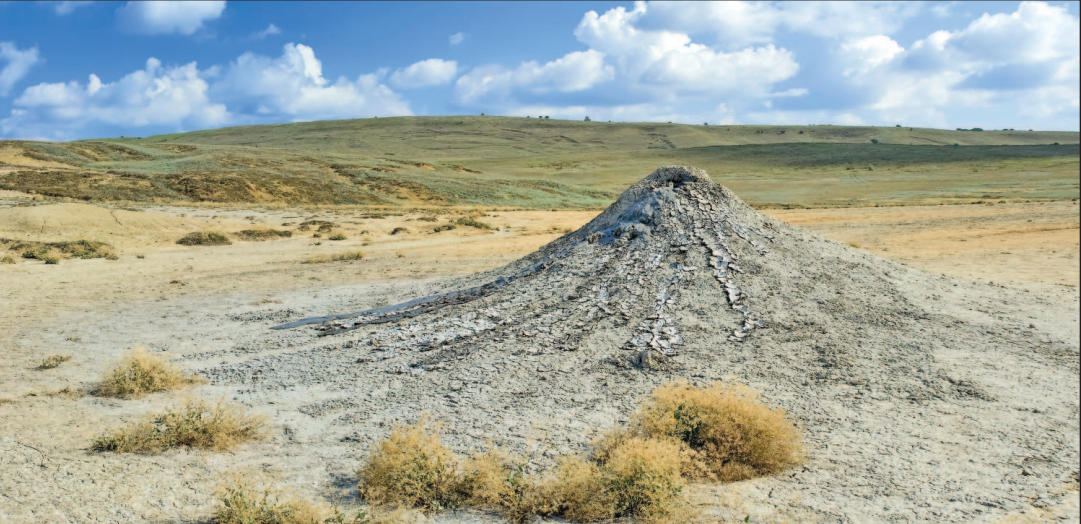
Конусообразный грязевой вулкан