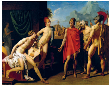
Жан Огюст Доминик Энгр. Послы Агамемнона у Ахилла. 1801 г. Национальная высшая школа изящных искусств, Париж

Самым известным представителем академизма этого времени был Жан Огюст