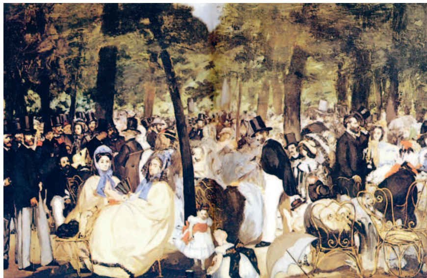
Эдуар Мане. Музыка в Тюильри. 1862 г. Галерея Хью Лейна, Дублин

го формата, на которой изображены похороны жителя маленького городка на востоке Франции — грустное и ординарное событие, написанное тёмными красками. Художник правдиво передаёт внешность немолодых