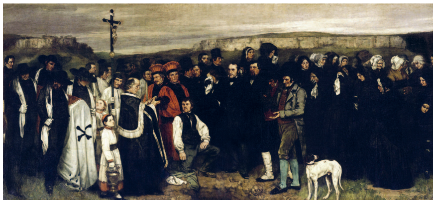
Гюстав Курбе. Похороны в Орнанах. 1849 — 1850 гг. Музей д'Орсэ, Париж

роны жизни: бедность, печальную старость, пьянство — то есть многое, что не вызывает эстетического восторга. Одной из самых показательных картин стала работа «Похороны в Орнанах» Гюстава Курбе. Это картина огромно-