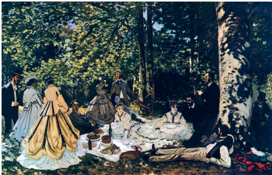
Клод Моне. Завтрак на траве. 1866 г. ГМИИ им. А.С. Пушкина, Москва

руку к тарелке, при этом внимательно смотрит на отдыхающего под деревом господина. Дамы слева ведут разговор между собой, а стоящая ближе всего к переднему краю картины собачка внезапно обернулась на них.