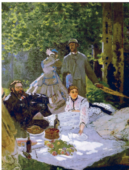
Клод Моне. Завтрак на траве. Фрагмент несохранившейся картины. 1866 г. Музей д'Орсе, Париж

Невзирая на правильность композиции, художник передал мгновение общения людей, непринуждённого и лёгкого. Ощущению лёгкости вторят пятна света и солнечные блики, скачущие по поверхностям. Свет проникает на лужайку сквозь ветви деревьев, часть листьев находится в тени, а часть — на солнце. Художник показал это разными оттенками зелёного, изобразив быстрые переходы от светлого к тёмному, — это даёт ощущение быстрого движения, трепета листьев. Пробиваясь сквозь ветви, свет оказывается на скатерти, и световые пятна всё время перемещаются, двигаясь вслед за движением деревьев.