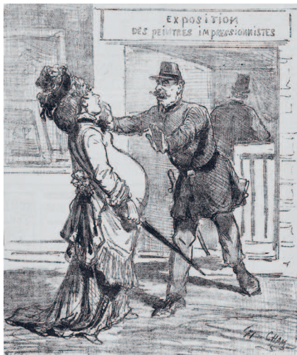
Карикатура на выставку импрессионистов. Французская иллюстрированная газета Le Charivari, 1874 г. Национальная библиотека Франции, Париж

и повышало ценность полотна. Проще говоря, чем дороже были предметы, показанные на картине, тем дороже становилась и сама картина. Данное обстоятельство подталкивало художников к созданию всё новых и новых полотен, изобилующих изысканными материалами.