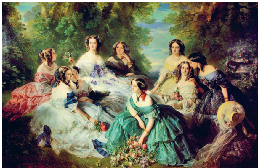
Франц Ксавер Винтерхальтер. Императрица Евгения и её дамы. 1855 г. Шато-де-Компьень, Компьень

Чтобы понять новый взгляд Мане, сравним его картину с работой мастера парадных портретов Франца Винтерхальтера. В 1855 году он также написал отдыхающих в тени деревьев француженок. На полотне «Императрица Евгения и её дамы» изображена супруга Наполеона III в окружении фрейлин. Художник показал её сидящей чуть выше остальных, в белом платье с фиолетовыми бантами, и выделил более интенсивным светом. Композиция картины абсолютно уравновешенная: левая часть соответствует правой, дамы показаны сидящими в кругу. В таком случае фон в виде деревьев кажется чем-то вроде декорации. Все дамы на картине — реаль-