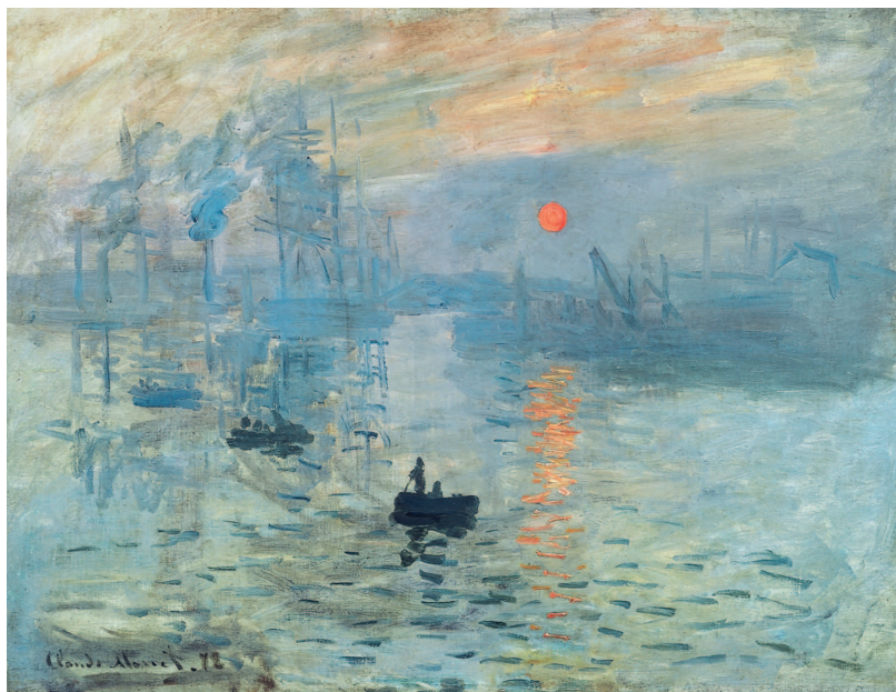
Клод Моне. Впечатление. Восходящее солнце. 1872 г. Музей Мармоттан-Моне, Париж

Французский зритель на ежегодных выставках, которые устраивала Академия художеств — главный орган в сфере искусства, определявший то, как должен работать живописец, — видел в основном картины современных ему мастеров.