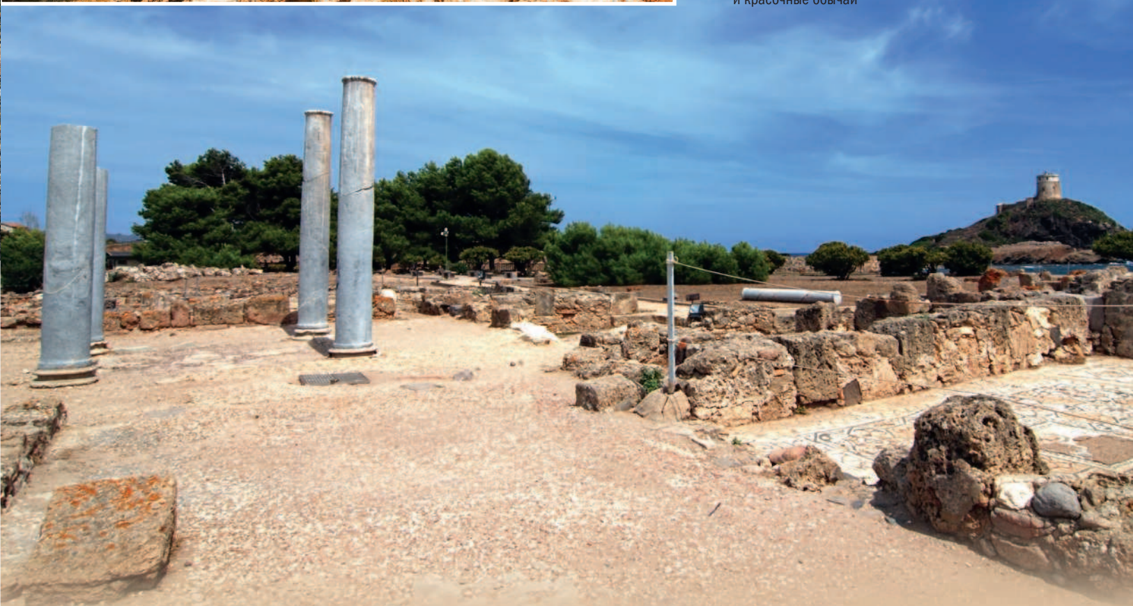
■ Самое привлекательное на Сардинии — величественные руины древнего города и красочные обычаи