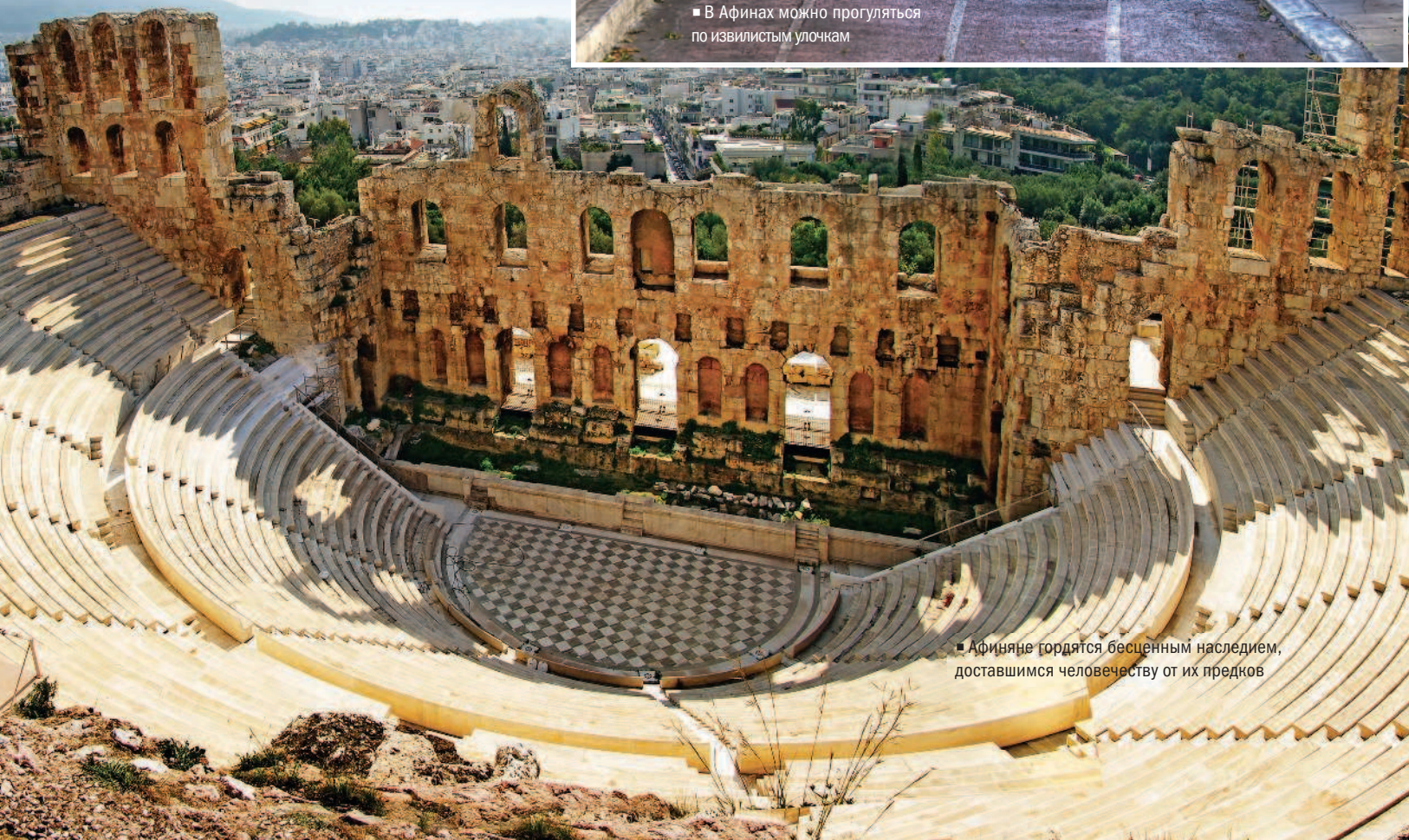
■ Афиняне гордятся бесценным наследием, доставшимся человечеству от их предков