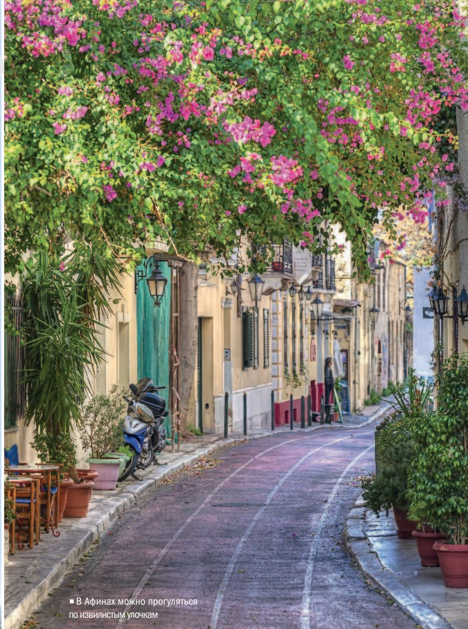
■ В Афинах можно прогуляться по извилистым улочкам

Афины — город древнегреческих мифов, возникший 3,5 тыс. лет назад. В городе вас встретят десятки интереснейших музеев, где представлены прекрасные творения эпохи Античности и более поздних периодов. Здесь вы узнаете множество легенд, связанных с городом и его окрестностями, откроете древние тайны. Главной достопримечательностью Афин и всей Греции считается афинский Акрополь. Это самый удивительный археологический памятник мира с потрясающими храмами и скульптурами. В 60 км от Афин расположен мыс Суннион, который считается наиболее романтическим местом. Здесь находится храм Посейдона. По преданию, самое сокровенное желание, загаданное у подножия этого храма на закате солнца, обязательно исполнится.