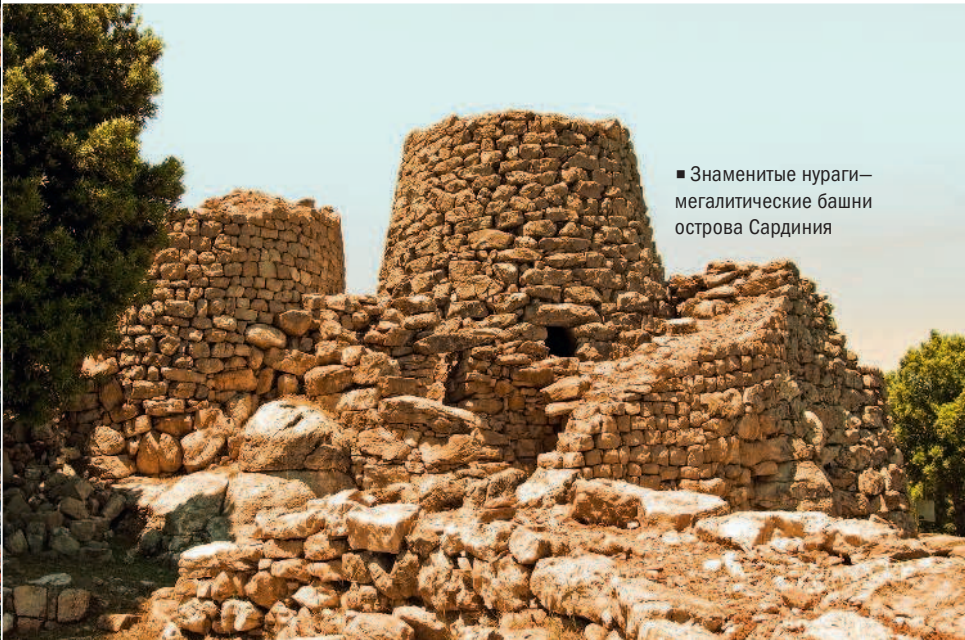
■ Знаменитые нураги— мегалитические башни острова Сардиния