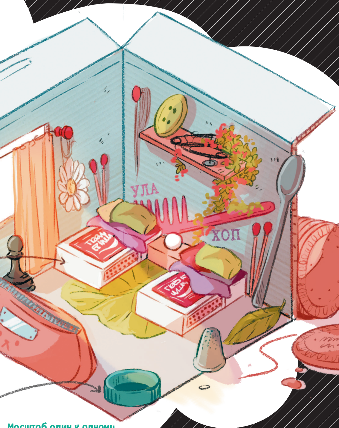
Масштаб один к одному