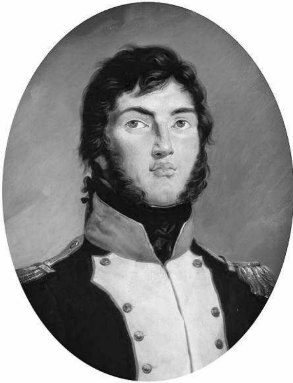
Луи-Габриэль Сюше (1770–1826) в чине подполковника, 1792 г. Фрагмент портрета работы В.-Н. Равера, 1834 г.

лерии считал необходимым поставить одну батарею на Аренской высоте, против форта Мальбоске, так, чтобы с нее на другой день после взятия Малого Гибралтара можно было открыть огонь; он рассчитывал, что огонь этой батареи произведет большое моральное воздействие на военный совет осажденных, который соберется для принятия решения.