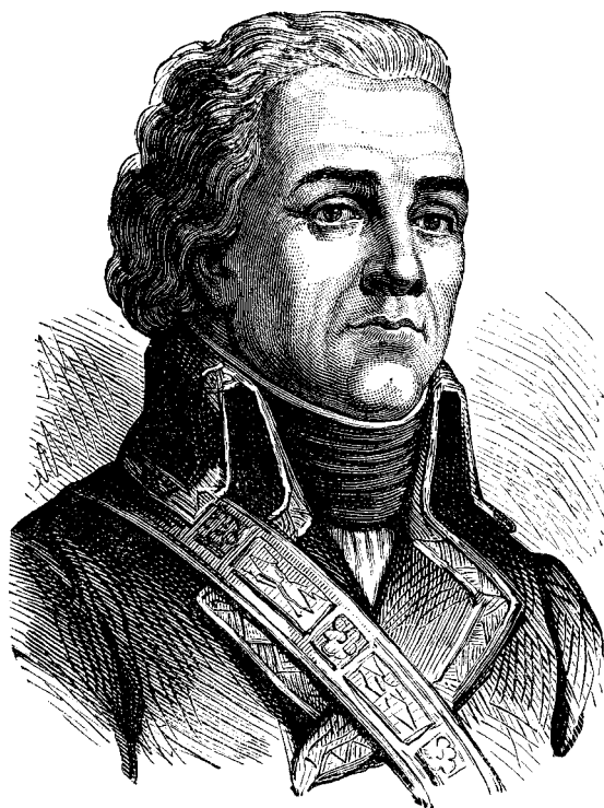
Жак-Франсуа Дюгомье (1738–1794). Гравюра Э. Тома с оригинала А. Руссо. Из «Альбома столетия...» (Париж, 1889)

Лионская армия была распределена между Альпийской, Пиренейской и Тулонской. Подкрепление оказалось не столь велико, каким могло бы быть. Вместе с ним в осадной армии находилось только 30 000 человек, считая и плохие, и хорошие войска. Главнокомандующий союзными войсками генерал О'Хара поджидал подкрепление из 12 000 пехотинцев и 2000 кавалеристов. Он надеялся добиться снятия осады, захватить олиульский парк, обойти французскую армию в Италии, а затем, соединившись с пьемонтской, расположиться на зимних квартирах по Дюранс и овладеть всем Провансом. В этой провинции недоставало продовольствия. Несколько попыток подвезти припасы, предпринятых марсельскими купцами, остались безрезультатными по причине занятия противником Тулона и присутствия английского, испанского и неаполитанского флота в Средиземном море. Эта часть республики возлагала все свои надежды на скорое падение Тулона, а между тем за четыре месяца с начала осады было обстреляно, по слухам, лишь одно полевое укрепление, расположенное в стороне от крепостных фортов; неприятель спокойно владел не только городом и фортами, но и всем пространством между городом, горою Фарон и фортом Мальбоске. Все усилия осаждающих предпринимались в направлении, противоположном городу, и это возбуждало общее неодобрение. Полагали, что осада даже не начиналась, так как против фортов и со-