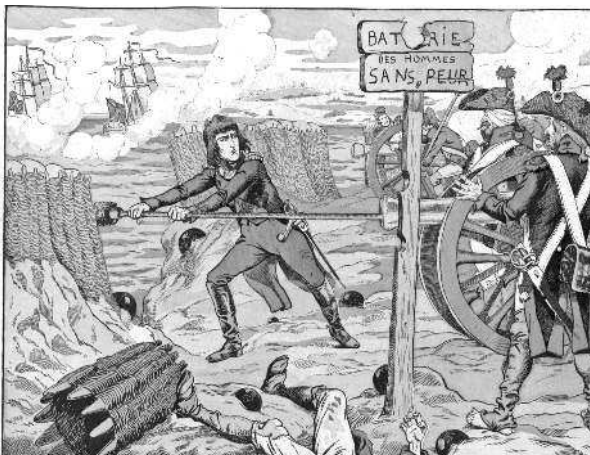
Генерал Бонапарт во время осады Тулона заряжает пушку, как простой солдат. На табличке надпись: «Батарея бесстрашных». Художник Жоб (Ж. Онфруа де Бревиль)

меньше, чем ее прекращение. Генерал разрешил ему принять атакующих под свое командование. Весь мыс был покрыт нашими стрелками, окружившими форт, и начальник артиллерии построил в колонну две гренадерские роты с целью проникнуть туда через теснину, как вдруг главнокомандующий приказал ударить отбой вследствие того, что вблизи от него, но довольно далеко от линии огня, был убит один из его адъютантов. Стрелки, заметив отступление своих и услышав сигнал отбоя, были обескуражены. Атака не удалась. Наполеон с лицом, покрытым кровью от легкой раны в лоб, подъехал к главнокомандующему и сказал ему: «...Велевший играть отбой не дал нам взять Тулон». Солдаты, потеряв при отступлении немало своих товарищей, выражали недовольство. Они громко говорили о том, что пора покончить с генералом. «Когда же перестанут присылать для командования нами живописцев и медиков?» Восемь дней спустя Дюппе был послан в Пиренейскую армию. Свое прибытие туда он ознаменовал гильотинированием большого числа генералов.