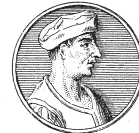
du President Perot

час много на земле императоров, королей, герцогов, князей и пап, произошедших от каких-нибудь продавцов индульгенций и носильщиков корзин, и, наоборот, немало больных и жалких нищих в странноприимных домах ведут свое происхождение по прямой линии от великих королей и императоров, если принять во внимание изумительный закон смены великих империй: