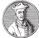
de M. Lasne