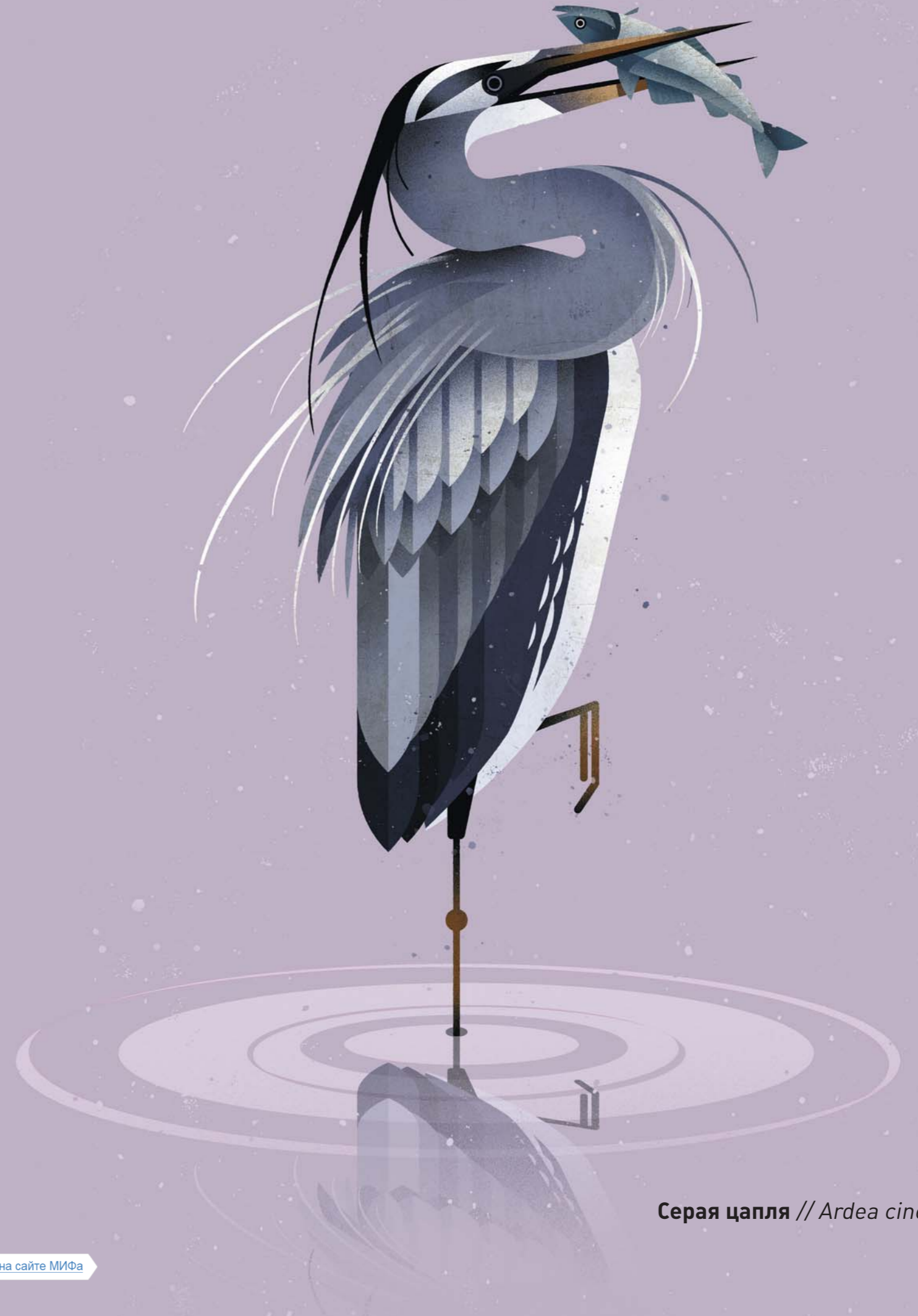
Серая цапля // Ardea cinerea