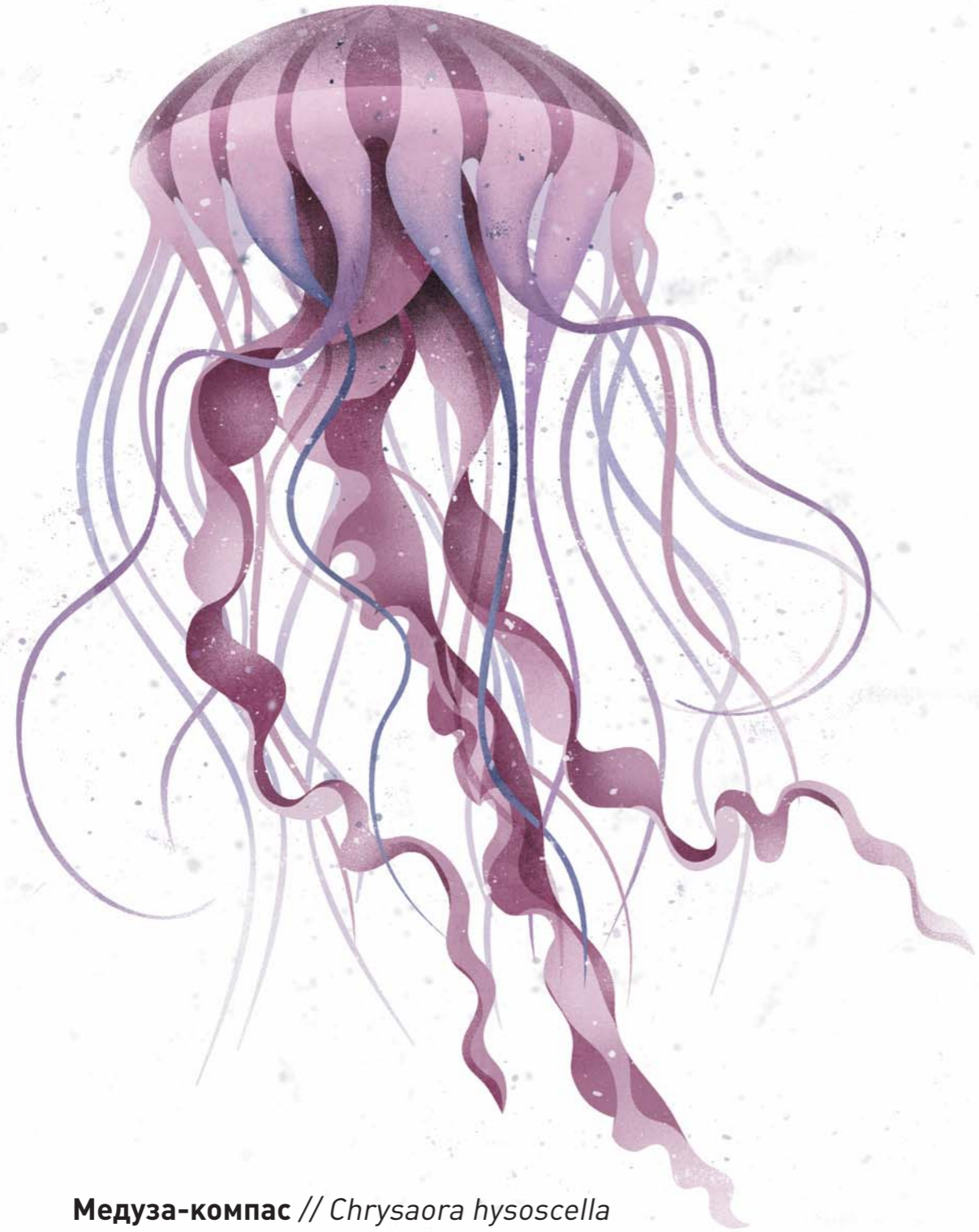
Медуза-компас // Chrysaora hysoscella