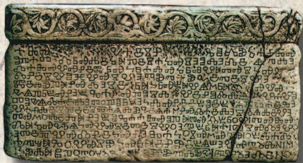
Одна из самых старых и хорошо сохранившихся глаголических надписей, найденная в Хорватии. XI–XII века

установить, наверное, уже не удастся никому, но схожесть балтийского и славянского языков не может не наталкивать на размышления. И если не было у них общего предка, то они переняли многие черты друг друга в процессе соседства племен.