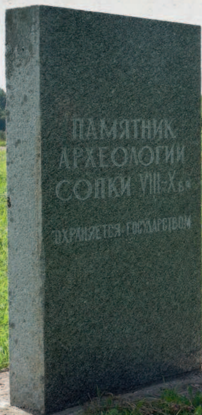
Древние славянские курганы VIII–X веков на берегу реки Волхов в окрестностях села Старая Ладога

Они же, в свою очередь, задумали пойти против самой Римской