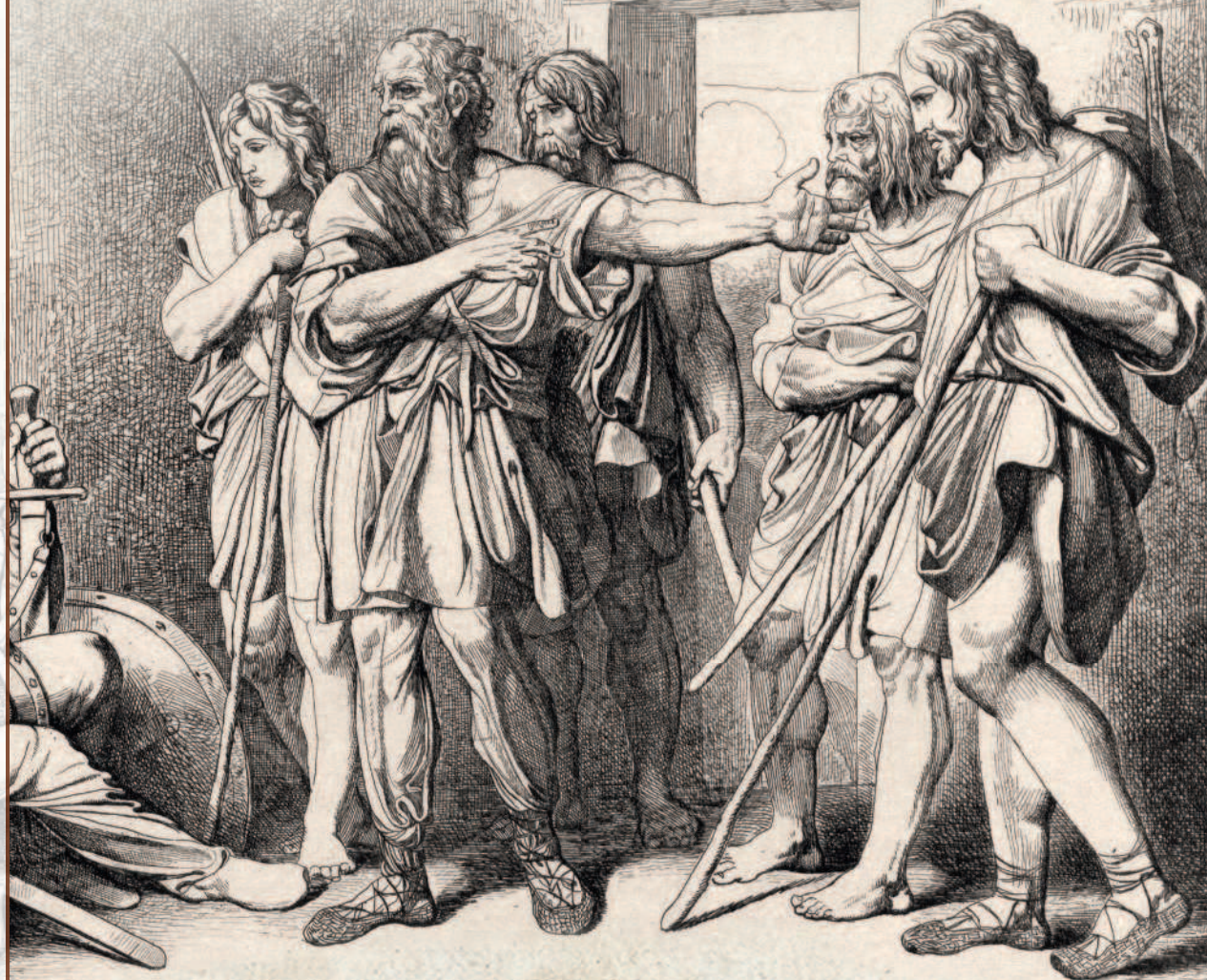
Призвание варягов. Рисунок Ф. А. Бруни из альбома «Очерки событий из российской истории, сочиненные и гравированные профессором живописи Ф. Бруни». 1839 год

Существует много версий о происхождении Рюрика. Иоакимовская летопись утверждает, что он был славянином, а его призвали на княжеский трон по велению Гостомысла — князя новгородского. У Гостомысла не было наследника, поэтому он решил не ввергать славянские и финно-угорские племена в пучину безвластия и братоубийственных войн, а пригласить варяга. Варяга, но только наполовину: матерью Рюрика была дочь Гостомысла, славянка. Рюрик пришел в 862 году вместе с братьями Синеусом и Трувором, а также со своей дружиной. Он остался в Новгороде, а братья отправились соответственно в Белоозеро и Изборск. Вскоре Синеус и Трувор умерли и Рюрик стал единоличным владельцем русских земель: от Западной Двины до Ладоги и от Средней Волги до Балтийского (тогда еще Варяжского) моря. Умер основатель княжеской династии Рюриковичей в 879 году, оставив правителем своего маленького сына Игоря, а пока тот не вырастет, назначил опекуном родственника Олега. Точное место смерти и захоронения, а также причина гибели Рюрика неизвестны.