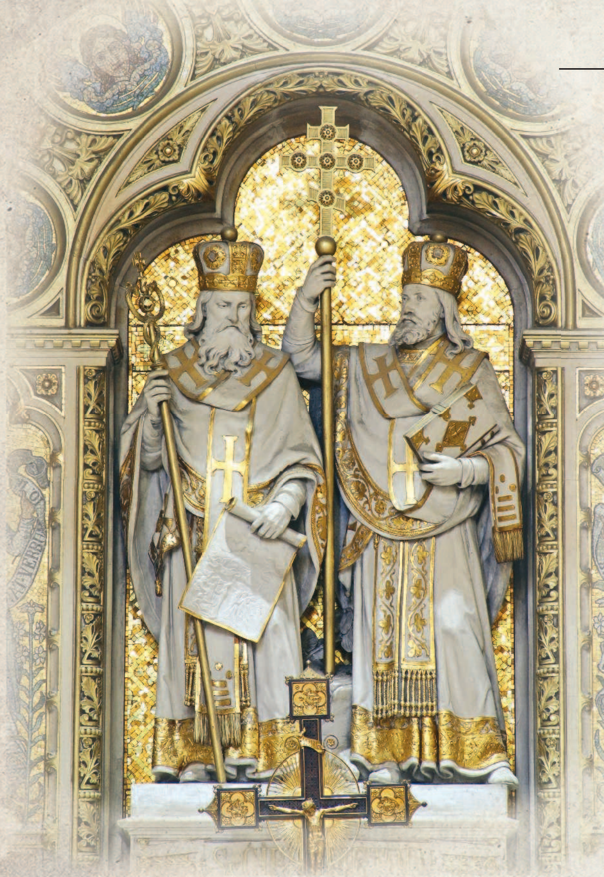
Фигуры Кирилла и Мефодия в кафедральном соборе. Город Загреб, Хорватия

Об этом нам говорят многочисленные заимствования.