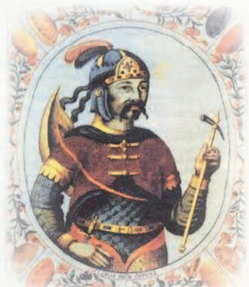
СОБИРАТЕЛЬНЫЙ ОБРАЗ РЮРИКА

Портрет из «Царского титулярника». 1672 год