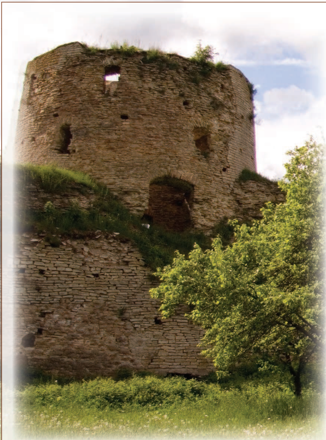
В Изборске находится одна из самых древних русских крепостей — сюда был отправлен княжить Трувор

империи. По пути в Константинополь Аскольд, Дир и их войско из полян и всех недовольных Рюриком не встречали особого сопротивления и опустошали чужеземщину. В это время византийский император Михаил III со значительными силами воевал с агарянами. Быстро вернувшись из похода, он сообразил, что силой скифов не возьмешь. Царьграду грозило разорение. Оставалось только уповать на чудо. И оно случилось. По легенде, патриарх Фотий опустил в спокойное море ризу Богоматери. Взволновалось тогда море, волны грудью стали на защиту православной Византии и потопили большую часть скифских кораблей. Уцелевших настолько поразило случившееся, что они не замедлили обратиться в христианскую веру и привезли ее с собой домой — в киевские земли. Таким образом, два славянских государства не только не стремились к мирному объединению, но и верили в разных богов.