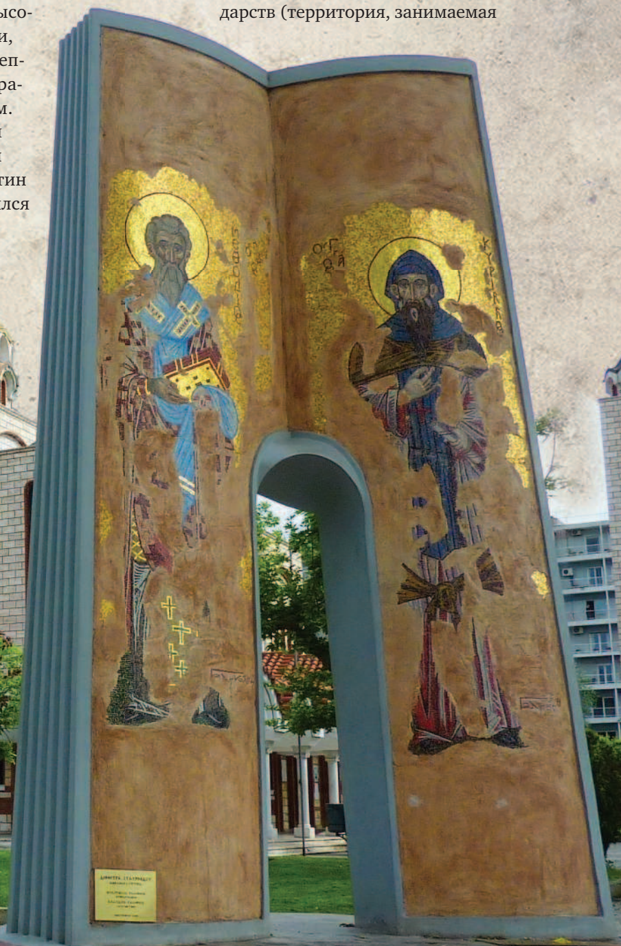
Церковь святых равноапостольных Кирилла и Мефодия. Город Фессалоники, Греция

Мефодию — настоятелю монастыря Полихрон, расположенного на берегу Мраморного моря. Вскоре Константин побывал с аналогичной миссией в Хазарском каганате, однако безуспешно. Через несколько лет его послали с новой миссией, на этот раз в Великую Моравию — одно из первых славянских государств (территория, занимаемая