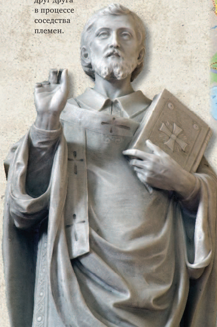
Статуя святого равноапостольного Мефодия в хорватском монастыре

установить, наверное, уже не удастся никому, но схожесть балтийского и славянского языков не может не наталкивать на размышления. И если не было у них общего предка, то они переняли многие черты друг друга в процессе соседства племен.