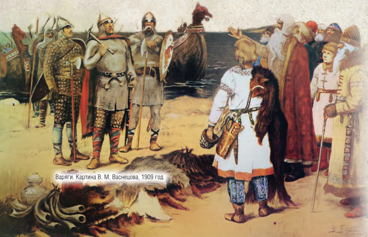
Варяги. Картина В. М. Васнецова. 1909 год