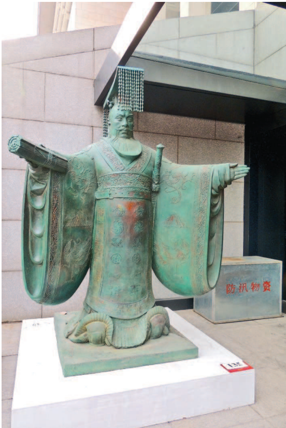
Император Цинь Шихуан-ди впервые объединил Поднебесную. Статуя в Национальном музее Китая. Пекин