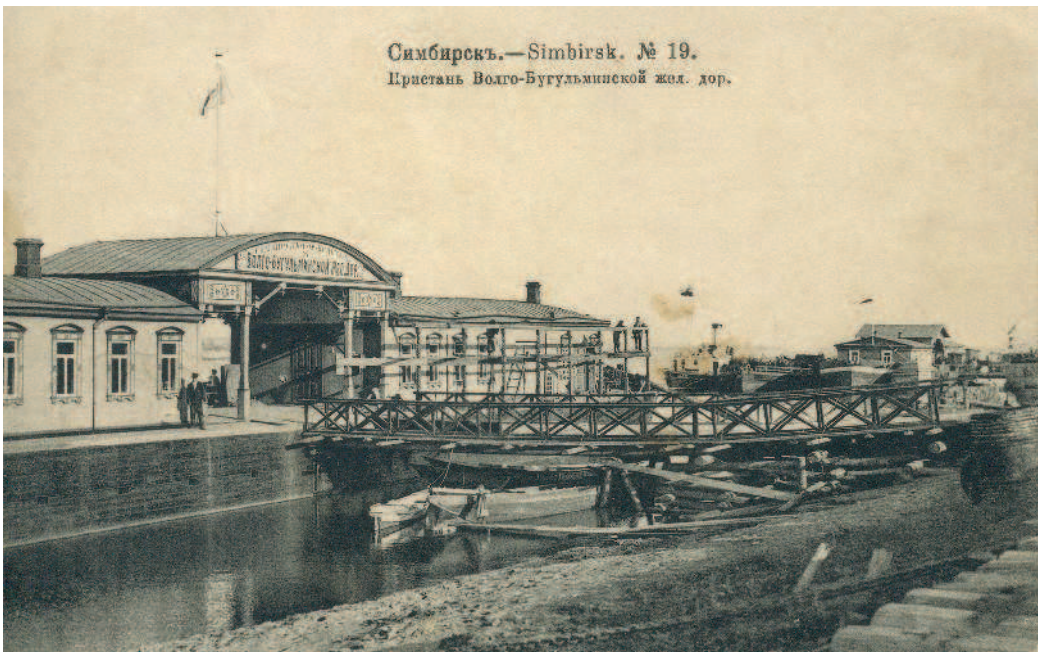
Симбирск. Пристань Волго-Бугульминской железной дороги