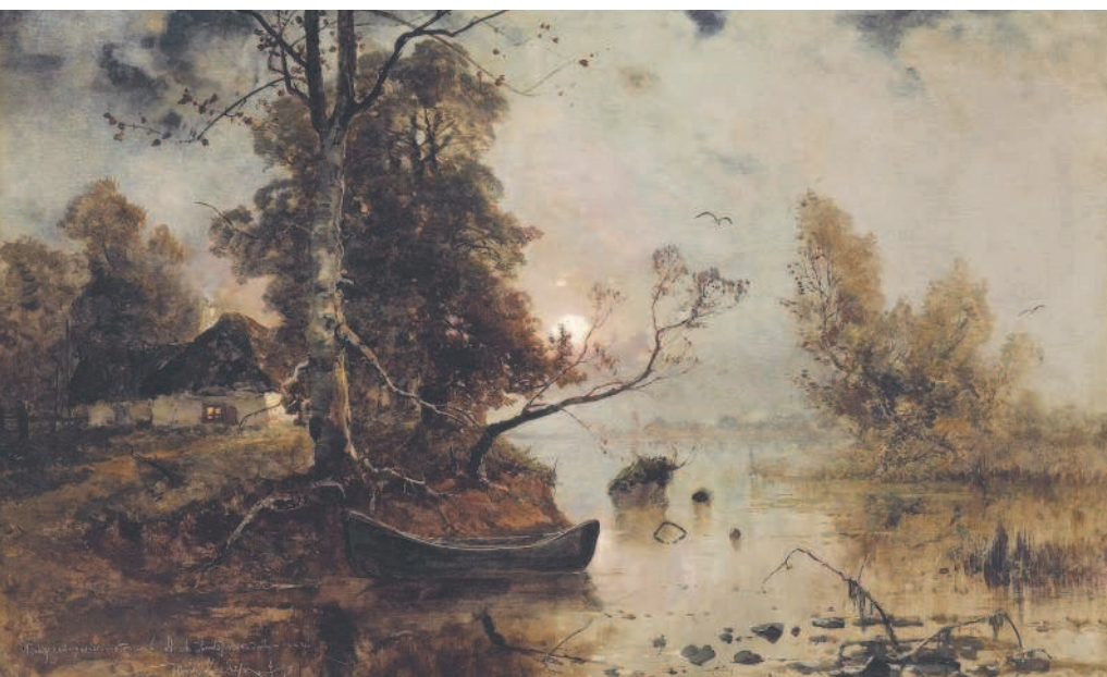
Закат на болоте. Ю. Ю. Клевер. 1898

На ночлег с полей пролетные гуси возвращаются только с последними лучами заходящего солнца, когда остальные пернатые уже давно погрузились в сон. Они садятся сначала на середину озера, а затем, прислушиваясь к подозрительным звукам, плывут в камыши. Там их уже могут ожидать силки или охотник на лодке