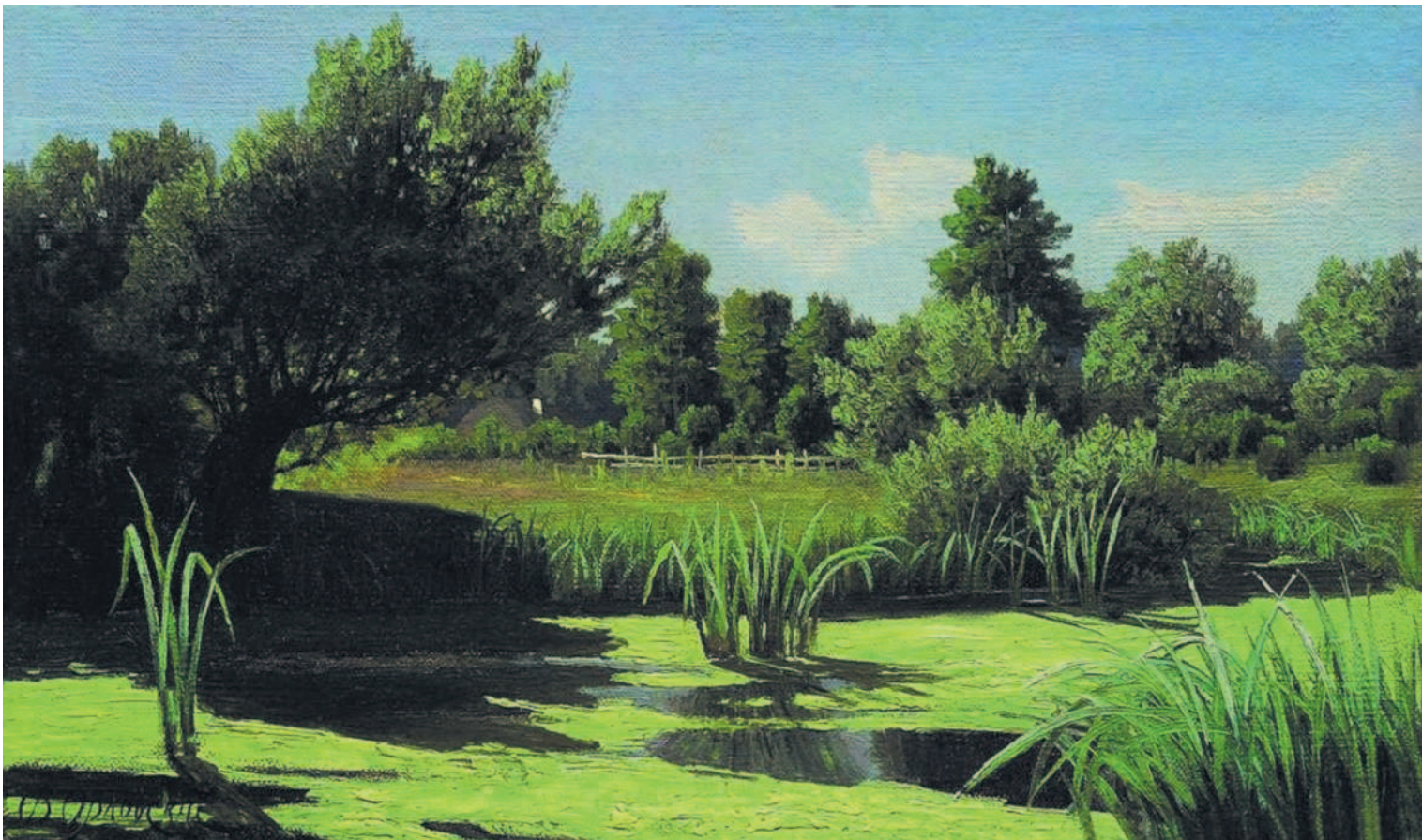
Камыши на реке. В. Д. Орловский. Вторая половина XIX – начало XX века

В силки гусей ловят исключительно по осени, так как весной их пролет незначителен и краток. Водяные птицы оставляют в камышах своеобразные тропинки, где и устанавливаются силки. Именно в таком положении, на прогалинах среди камышей, они имеют наибольшие шансы принести охотнику хороший улов