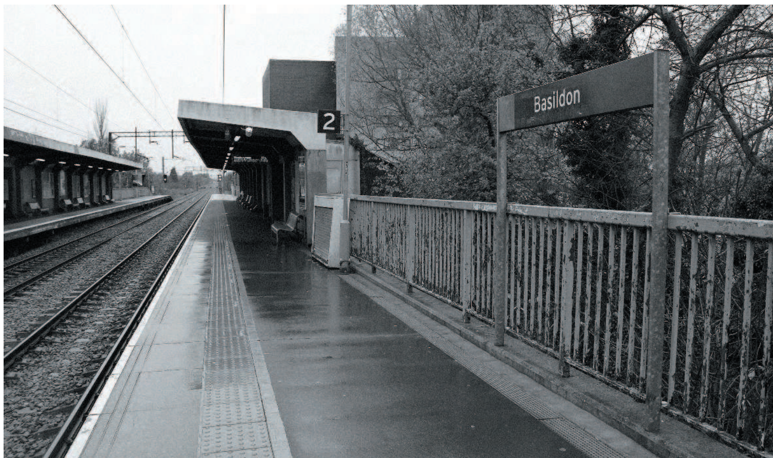
БАЗИЛДОН, ЖЕЛЕЗНОДОРОЖНАЯ СТАНЦИЯ. Доброе утро, Печаль...

Традиционные для любой рок-группы гитара, бас и ударные уступили место новым инструментам — удивительным творениям электронной музыки: всего несколько лет назад драм-машины и синтезаторы были непозволительной роскошью для подростков из рабочих предместий, а теперь все больше ребят могли воспроизводить себе купить эти футуристичные штуковины, которые вполне способны были оказаться в кабине «Тысячелетнего сокола» Хана Соло. Началась новая эра: в 1982 году в заметке в немецком журнале Der Spiegel речь шла о «поп-музыке для поколения "Звездных войн"», и имелось в виду бесчисленное множество новых британских электронных групп. Раньше монофонические синтезаторы могли производить за раз всего один звук и играть на них можно было одним пальцем. Не требовалось знать аккорды, чтобы создавать мелодии. Одним из самых радикальных примеров этой новой футуристичной электронной музыки стала немецкая электро-панк-группа Deutsch Amerikanische Freundschaft («Германо-американская дружба»), сокращенно DAF, в особенности их LP-альбом (долгоиграющий) Die Kleinen und Die Bösen .