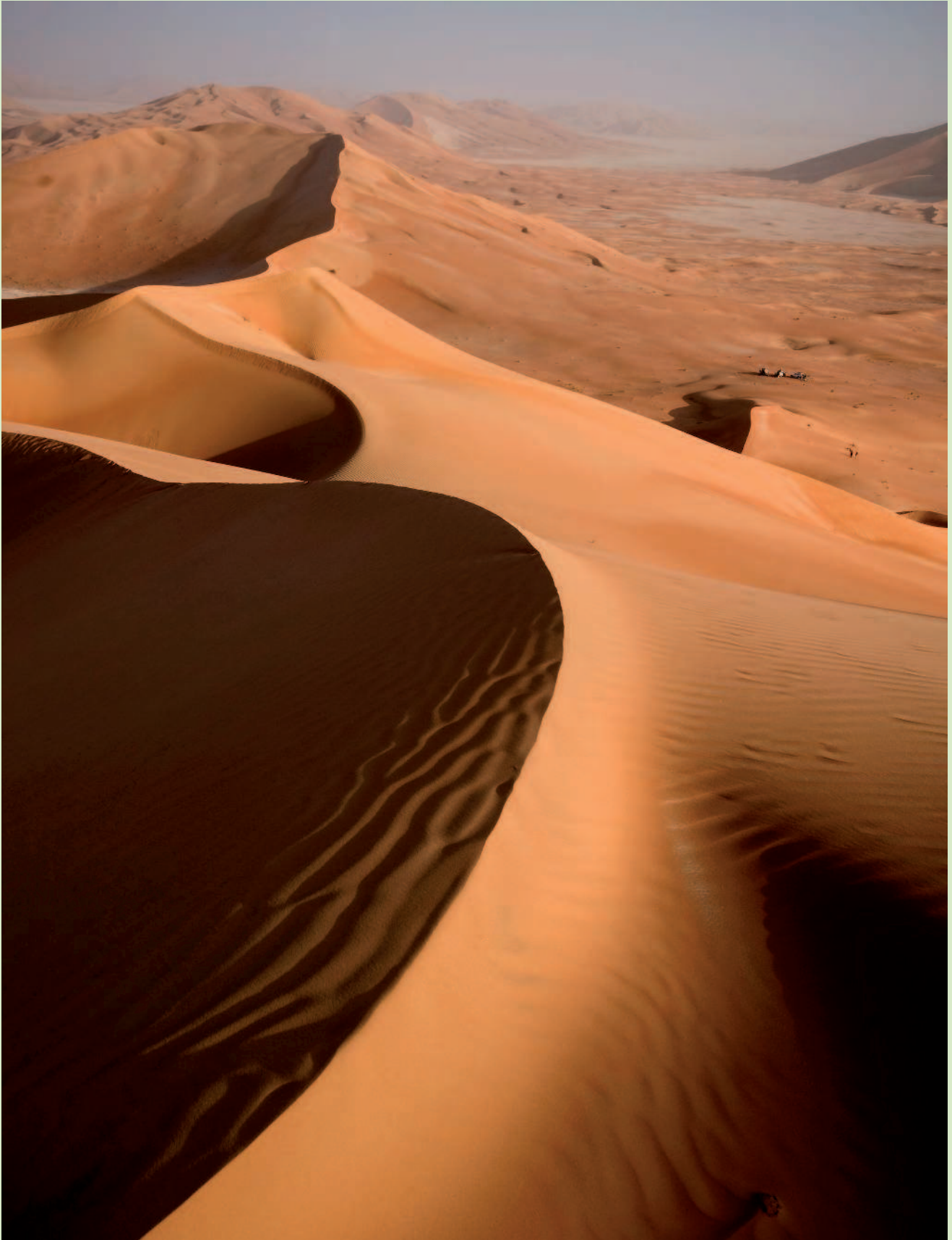
Бесконечные просторы вылепленных ветром дюн и безграничные возможности для приключений