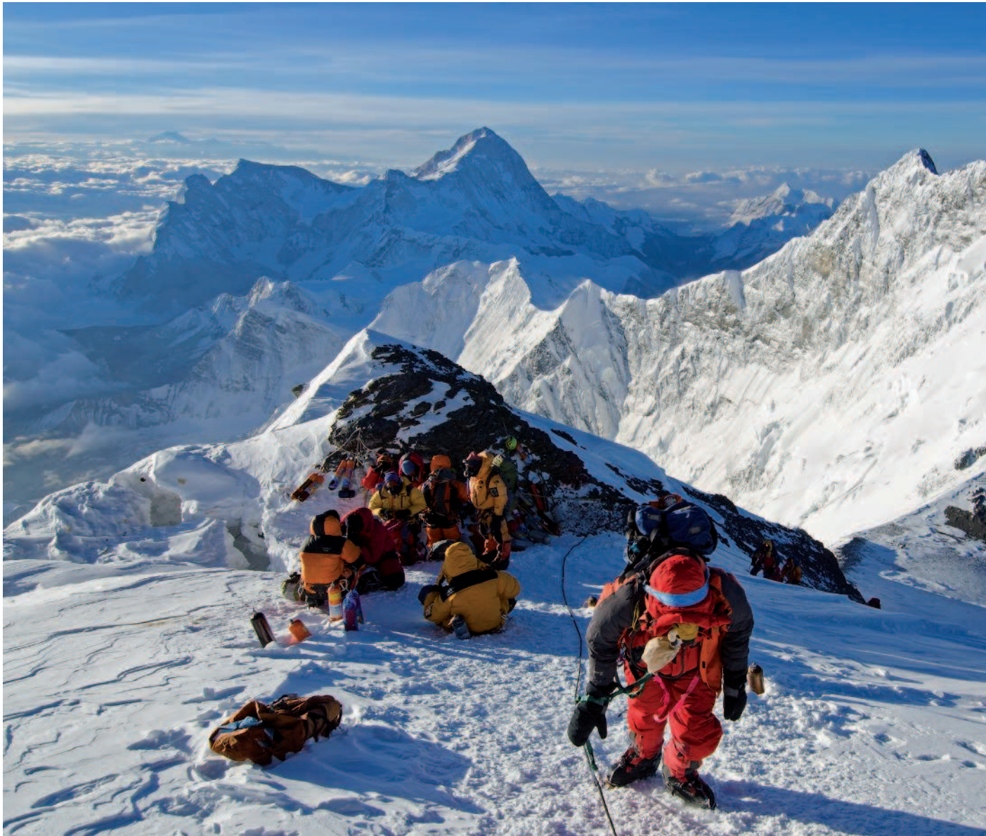
Совершите восхождение на гору Эверест: насладитесь видами с вершины мира