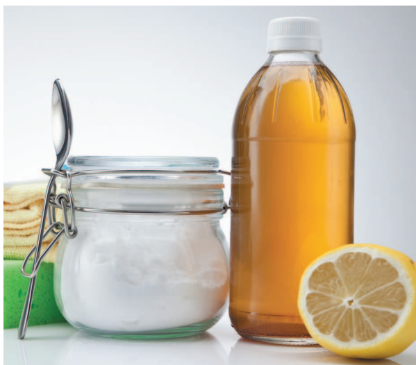
Сода и уксус — это отличное нетоксичное сочетание

намного безопаснее для экологии, но действуют аналогично другим детергентам и в отдельных случаях могут открыть двери для многих болезней.) Вот тогда с моих глаз упала пелена. Дом и правда можно убирать с помощью простых веществ. Я уже более тринадцати лет навожу порядок без использования детергентов и совершенно по ним не скучаю.