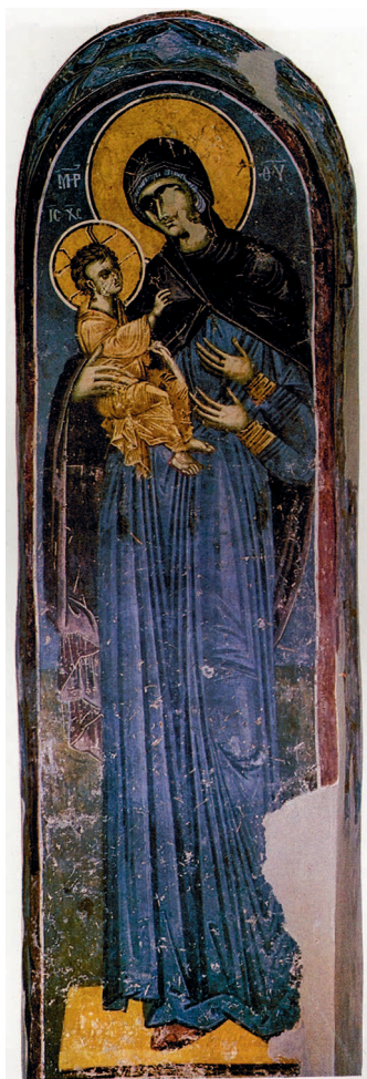
■ Иконостас Белой церкви. 1340–1342. Сербия. Село Каран

в сербский монастырь Хиландар на Афоне, потом — в Сербию, а в конечном итоге снова возвращается в Хиландар.