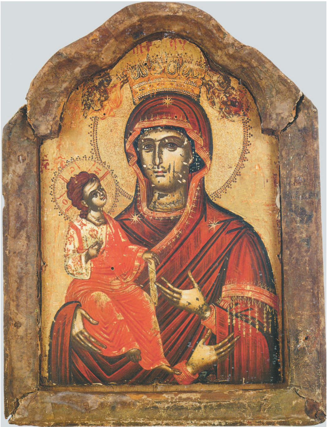
■ Икона Божией Матери «Троеручица». Ок. 1350. Афон. Монастырь Хиландар