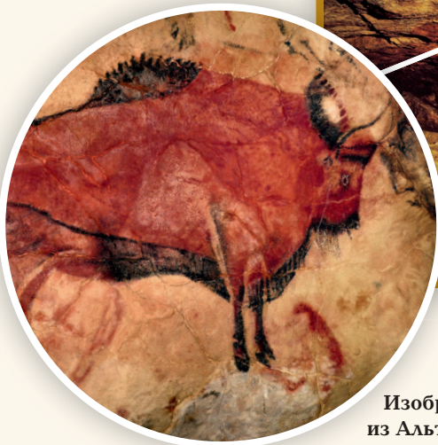
Изображение красного бизона из Альтамиры хорошо известно. Такие художники, как Пабло Пикассо, восхищались им и считали совершенством.