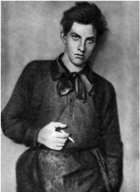
В. Маяковский — ученик Строгановского Училища. Москва, 1910 г.