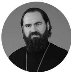
архиепископ Пятигорский и Черкесский ФЕОФИЛАКТ