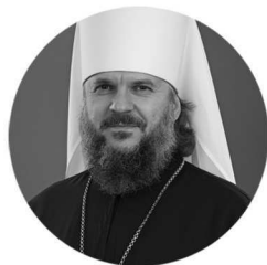
митрополит Тверской и Кашинский АМВРОСИЙ