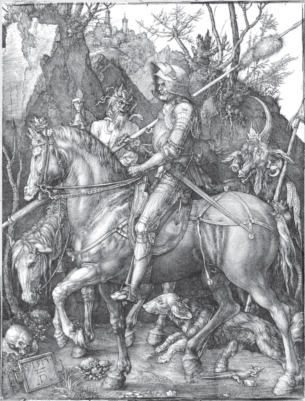
Рыцарь, смерть и дьявол. 1513