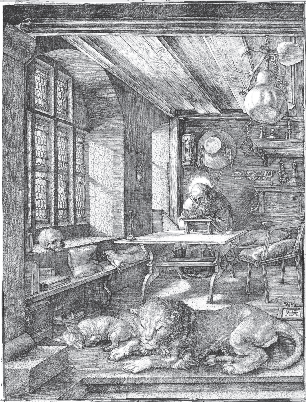
Святой Иероним в келье. 1514