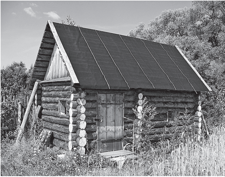
Иллюстрация 1. Современная версия деревенской бани “по-черному”. Новгородская область, 2004 год.

людная нагота может способствовать честности и эмоциональной близости, но она же порой порождает распушенность и уязвимость 2 .