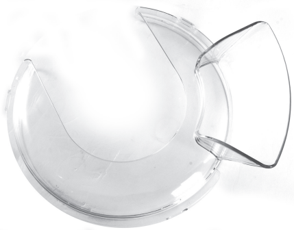
Крышка с загрузочной горловиной