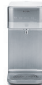
СИСТЕМА ОЧИСТКИ ВОДЫ K890