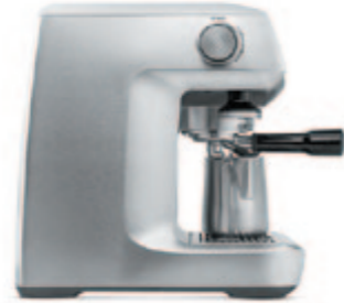
КОФЕЙНАЯ СТАНЦИЯ C802