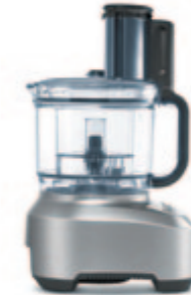
КУХОННЫЙ КОМБАЙН B801