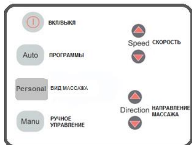
Рисунок 1. Пульт управления –схема

3. При нажатии кнопки «Manual» прибор перейдет в режим ручного управления, в котором возможно установить скорость и направление массажа, для этого необходимо использовать кнопки «Speed» и