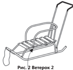
Рис. 2 Ветерок 2