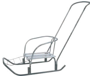
Рис. 6 Ветерок 7

ООО «Ника» 426052, Россия, Удмуртская Республика, г. Ижевск, ул. Лесозаводская, д. 23 тел. (3412) 55-00-00, e-mail: info@nikaltd.ru www.nika-foryou.ru