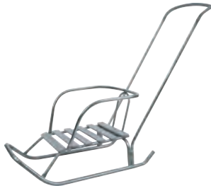
Рис. 5 Ветерок 6