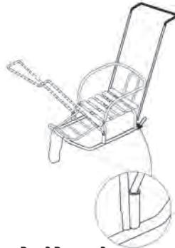
Рис. 3 Ветерок 3