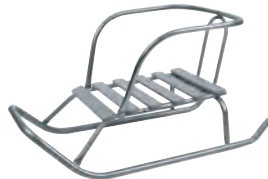
Рис. 4 Ветерок 5