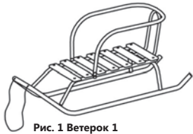
Рис. 1 Ветерок 1