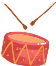
ба р абан