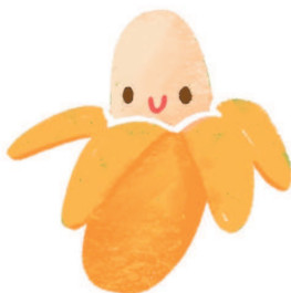
ба н ан