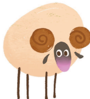
ба р ан