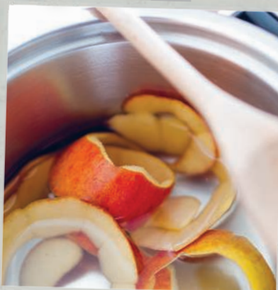
Осень и Хэллоун 210