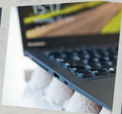
Работа и учеба 229