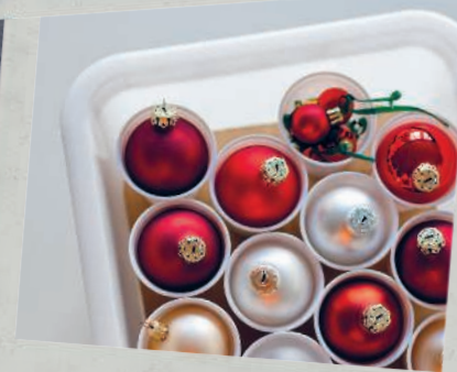
Зима и Новый год 324