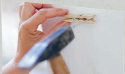
Поделки своими руками 293