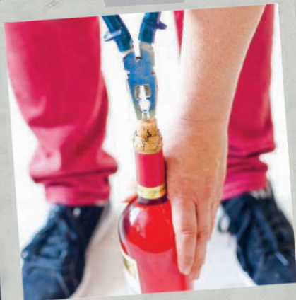
Гости и праздники 176