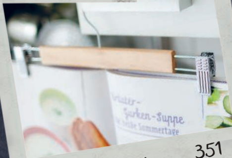
Еда и напитки 351