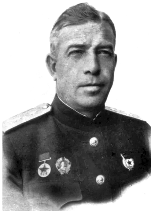
Командующий 50-й армии генерал А.Н. Ермаков (послевоенная фотография).

13 октября Г.П. Коротков организовал штаб обороны, который возглавил лично.