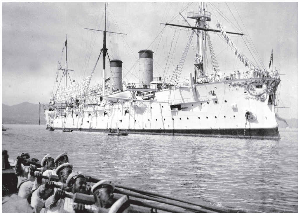
«Постройка «Рюрика» вызвала, как уже указывалось ранее, переполох в английских военно-морских кругах»

но стали строить быстроходные корабли этого класса с облегченной артиллерией.