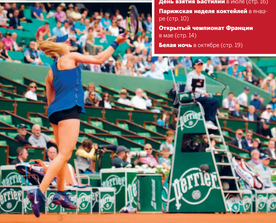
ДЖИМБЕД РИСТОЯРИН/ШИПЕРСКИЙ ©