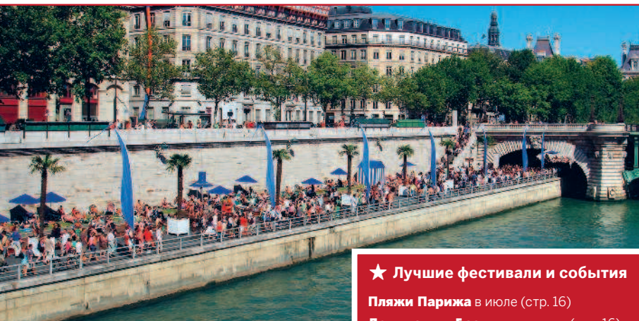
ЕВГЕНИЙ ШИПЕРСКИЙ ©