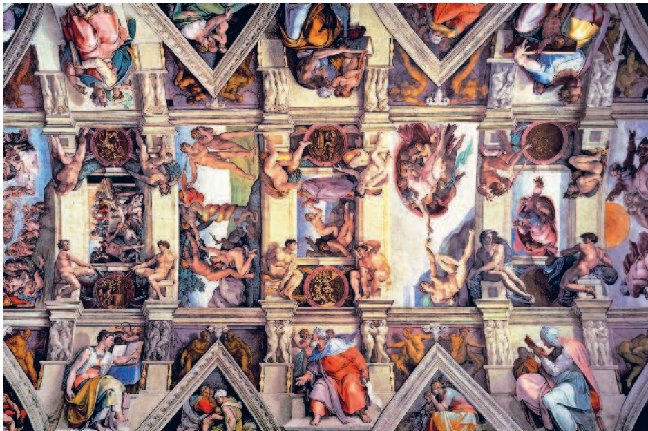
SISTINE CHAPEL CEILING AND LUNETTES, 1508-12 (FRESCO) (POST RESTORATION), BUONARROTI, MICHELANGELO (1475-1564)