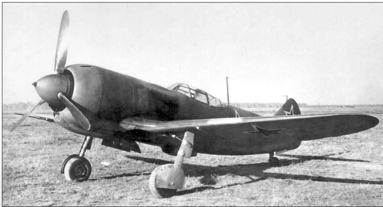
Самолет Ла-5 № 39210109

Ввели дополнительные щитки, полностью закрывавшие убранные колеса основных опор шасси. Кроме этого, улучши-