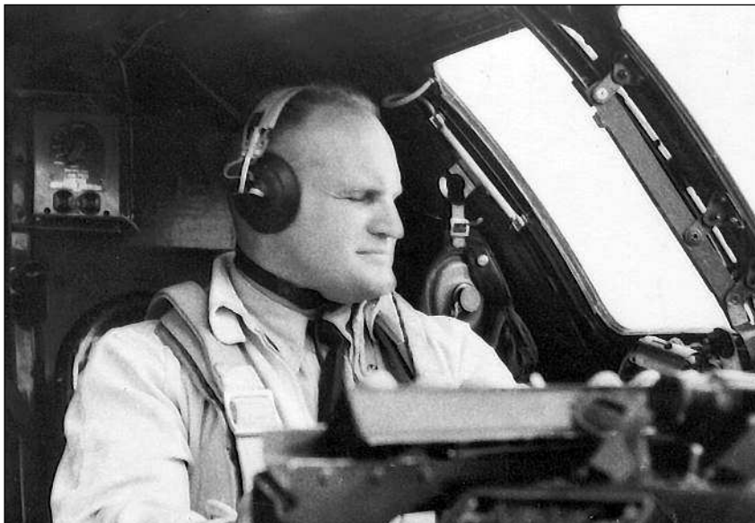
Летчик-испытатель ЛИИ Г.М. Шиянов

2500 в минуту у земли давало прирост скорости 30–35 км/ч и должно составить 630 км/ч».