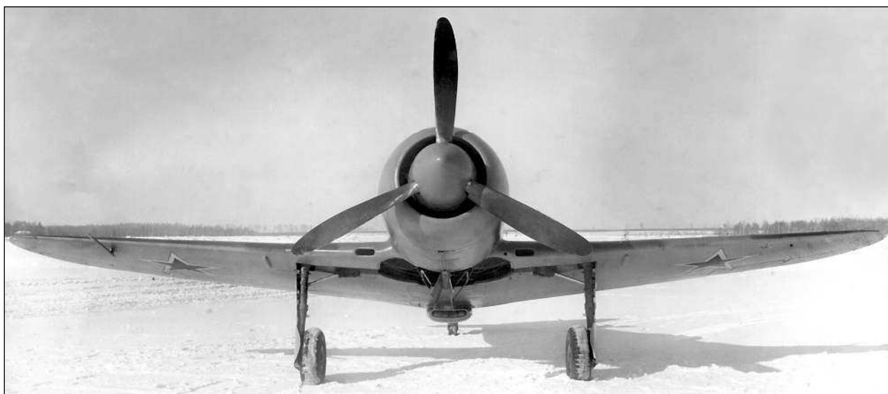
«Эталон 1944 года»

была достигнута максимальная скорость у земли 596 км/ч при закрытом фонаре и полностью закрытых боковых створках охлаждения мотора. Давление наддува составляло 1000 мм рт. ст., а обороты двига-