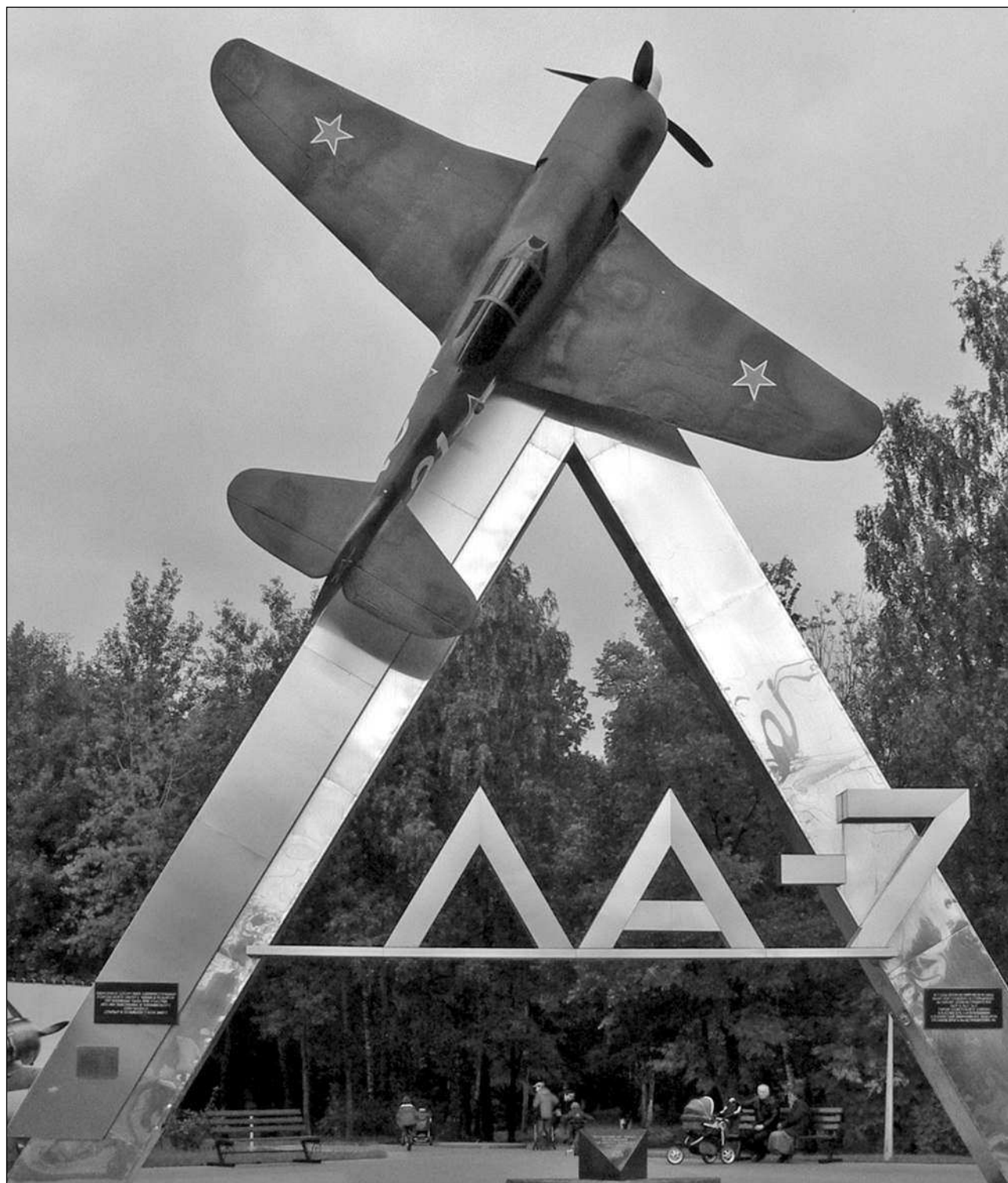
Макет Ла-7 — визитная карточка подмосковного г. Химки.