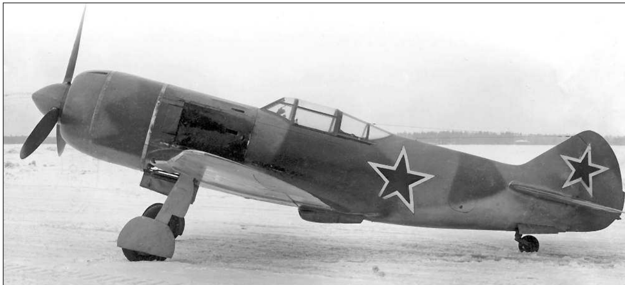
«Эталон 1944 года»

ЛИИ Н. В. Адамович, из-под капота мотора вырвалось пламя, и испытателю пришлось покинуть горящую «летающую лабораторию» на парашюте.