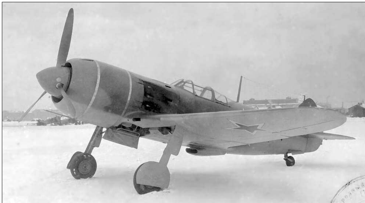
Первый серийный экземпляр Ла-7, собранный на заводе № 381

Решение о разворачивании серийного производства истребителя «Эталона 1944 года», получившего обозначение Ла-7, приняли еще до утверждения отчета о результатах его государственных испытаний.