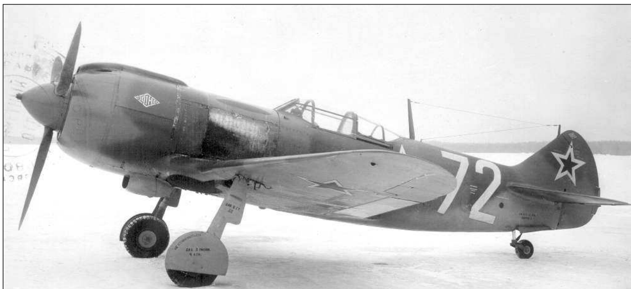
Ла-5ФН завода № 381

В заключение отчета по результатам аэродинамических исследований специалисты ЦАГИ рекомендовали заводу № 21 немедленно внедрить в серию мероприятия по герметизации капота, изменению