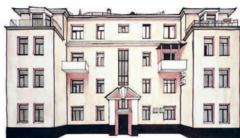
Дом кооператива «Основа» Макаренко, 8 23