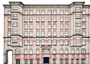
Дом купца Федора Зябкина Первый Обыденский пер., 9/12 191