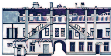
Дома купца Василия Сиротинина Покровка, 4 43