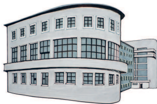
Общежитие Коммунистического университета национальных меньшинств Запады имени Ю.Ю.Мархлевского Петроверигский пер., 6-8-10 55