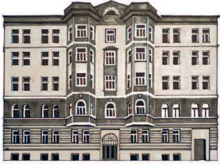
Дома дворянина Виктора Чернопятова и купца Василия Панюшева Брюсов пер., 2/14 233