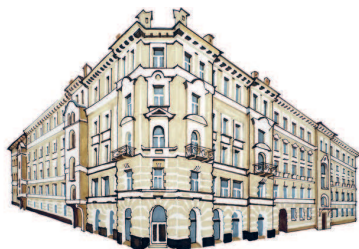
Дома Варваринского акционерного общества домовладельцев Остоженка, 7/15 179