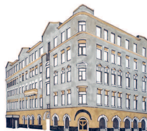
Дом дворянина Василия Суходольского Поварская, 29/36 223