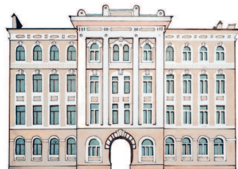
Дом Общества электрического освещения 1886 года Садовническая, 11 125