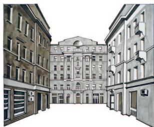
Дома Московского купеческого общества Солянка, 1/2 89