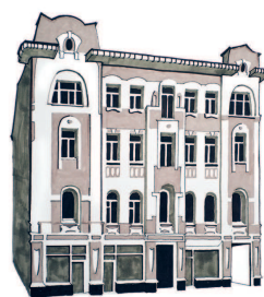
Дом купца Аникиты Громова Пятницкая, 17 137