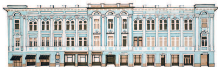
Дом вдовы тайного советника Серафимы Давыдовой Мясницкая, 13, стр. 3 13