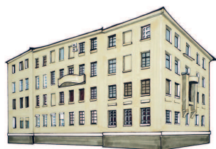
Дом архитектора Бориса Шнауберта Хохловский пер., 3 63