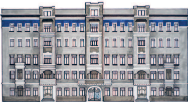
Дом купца Ильи Пигита Большая Садовая, 10 257