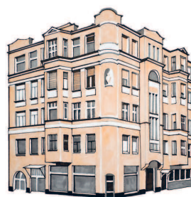
Дом мещанина Алексея Нырнова Сивцев Вражек, 6/2 203