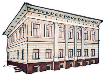
Дом писателя Николая Телешева Покровский 6-р, 18/15 103