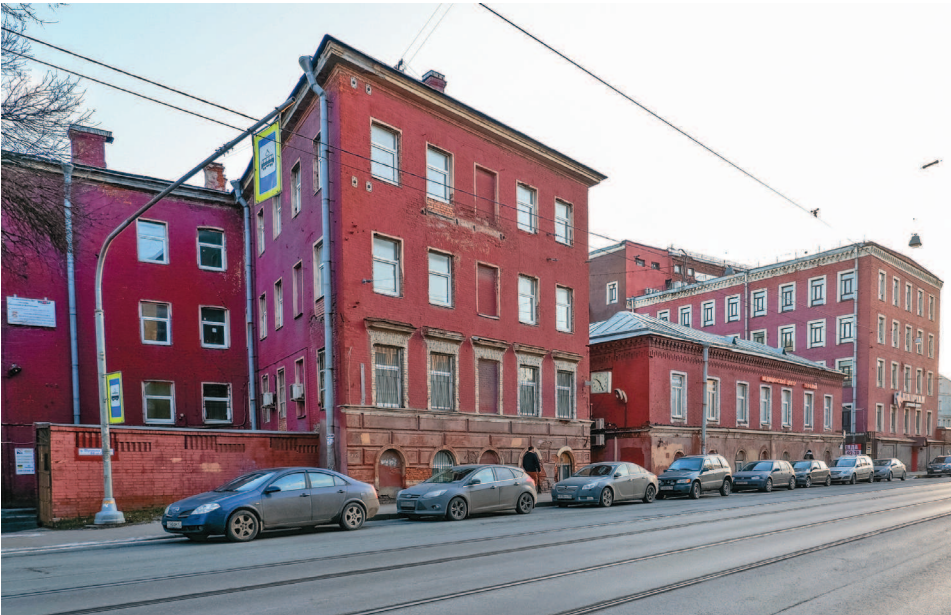
Бывшая фабрика Максвелла на проспекте Обуховской Обороны

вестно, как часто опорожнялись ямы «Максвелловских казарм», но в казармах других текстильных предприятий, например, была заведена традиция очищать их дважды в год — к крупным церковным праздникам.