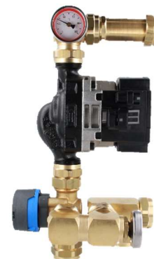
Рис.1 Смесительный модуль BRU с клапаном ARV ProClick

Смесительный модуль BRU для отопления полов с клапаном ARV ProClick разработан как соединительный элемент между системой отопления по стороне источника тепла и распределителем панельного отопления (например, напольного). Он используется для подготовки теплоносителя требуемой температуры, который затем перекачивается в нагревательные контуры коллектора. Оснащен поворотным смесительным клапаном ARV 362 ProClick. Пропорцию смешивания на выходе из модуля можно установить вручную с помощью ручки клапана. Однако мы рекомендуем использовать электропривод ARM ProClick или подходящий регулятор (например, АСТ) для регулирования температуры смешанной воды. Модуль может использоваться совместно с коллекторами с количеством отопительных контуров от 2 до 18.